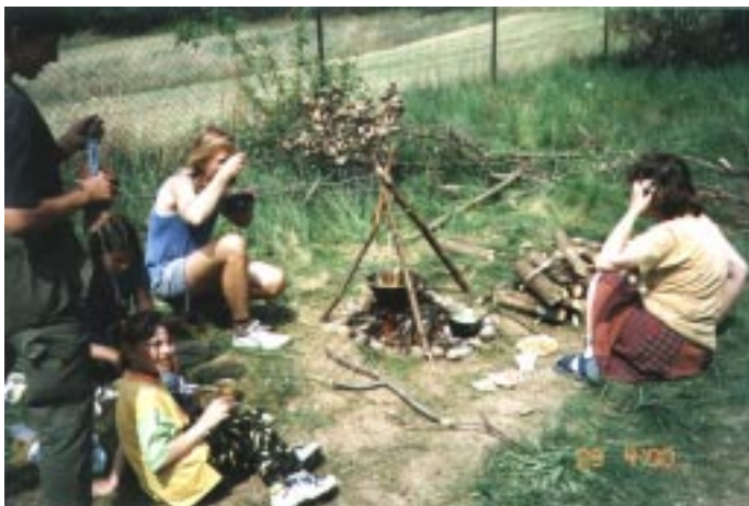
Výprava do Viničných šumic 28.4 - 1.5.

Řekl bych, že ač máte ještě co trénovat, tak tato disciplína dopadla celkem dobře. Leč nebyl bych to já, kdybych neměl ke všemu nějakou připomínku. Vaše batohy se mi líbí, až na pár výjimek, které jako by byly vybírány dle mých „dobrých rad“ v úvodu. Nelíbí se mi ale způsob, jakým je nosíte a raději jsem se ani moc neřval, jak jsou sbalené a pro