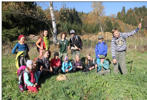
15.-16. 9. „Indiánské léto - den otevřených týpí“ 13.-14. 10. táboření u Větší Vltavice