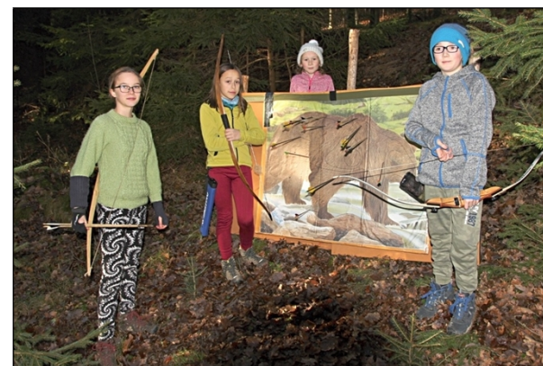
28. 12. 1. ročník Zimního medvěda (klání v terénní lukostřelbě pro ty kdo udrží luk)