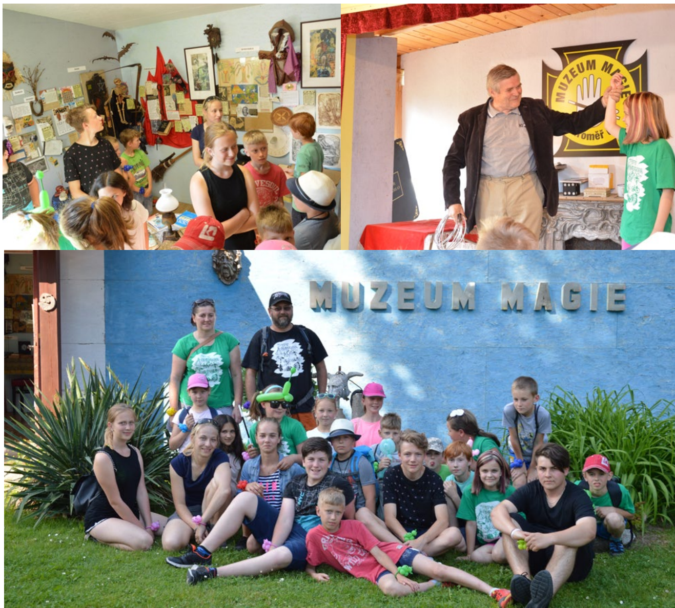
Tawiskara (27. - 30. 9. 2018)