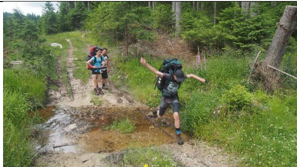
17.7.-1.8.2021 – Táboření LLM