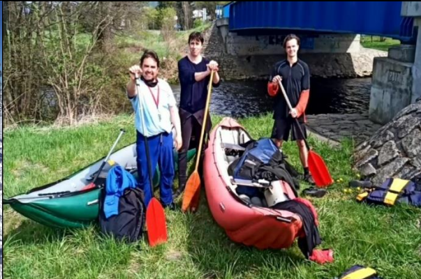
6.-8.5.2021 – Vodácké putování na Ploučnici