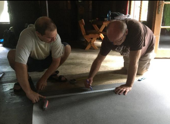
25. – 28. 9. 2021 – Klobásová výprava