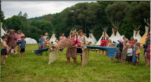
14. – 21. 8. 2021 – Brigáda na Bobřím hradě