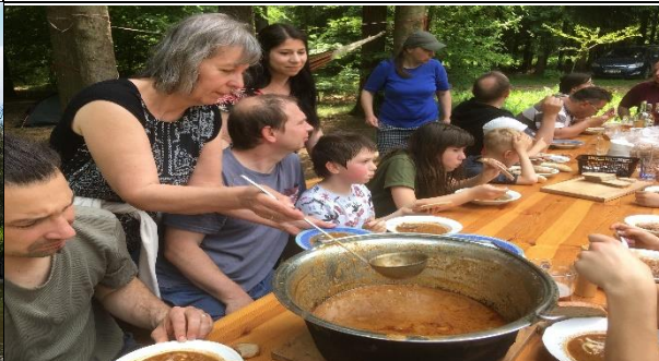
2.-6.7.2021 – Putování Novohradskými horami