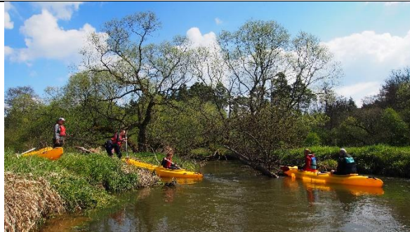
4.-6.6.2021 – Jarní akce na srubu