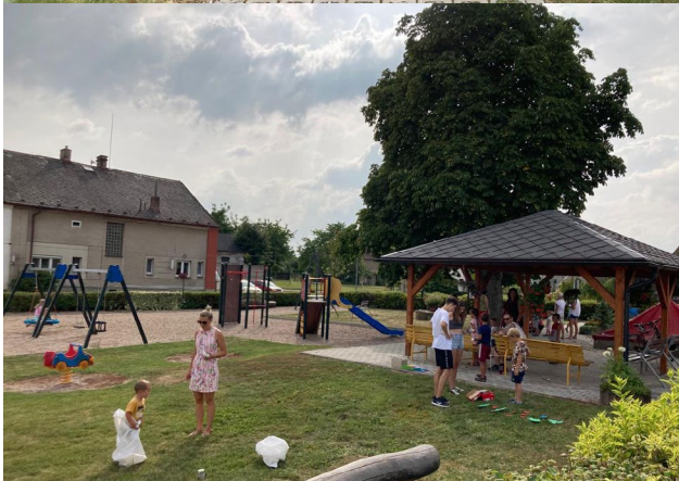
Tawiskara (23. - 25. 9. 2022)