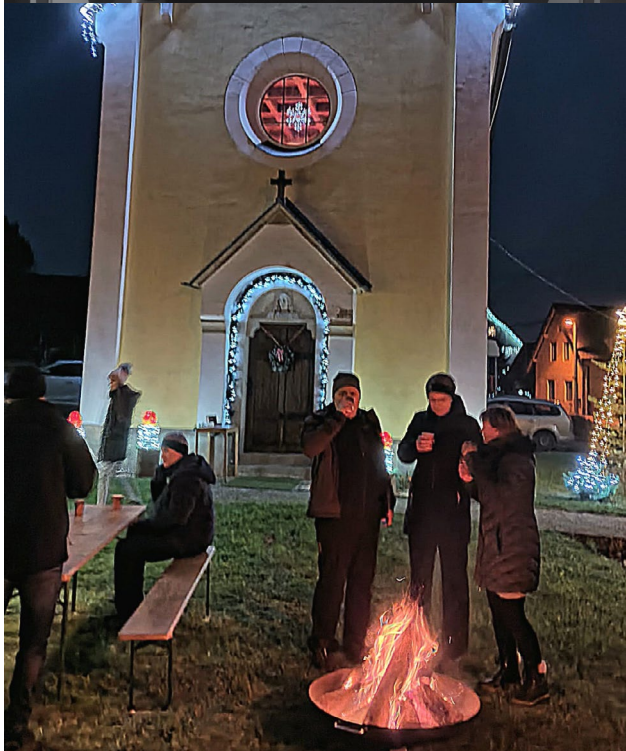
Betlémské světlo (23. - 24. 12. 2022)