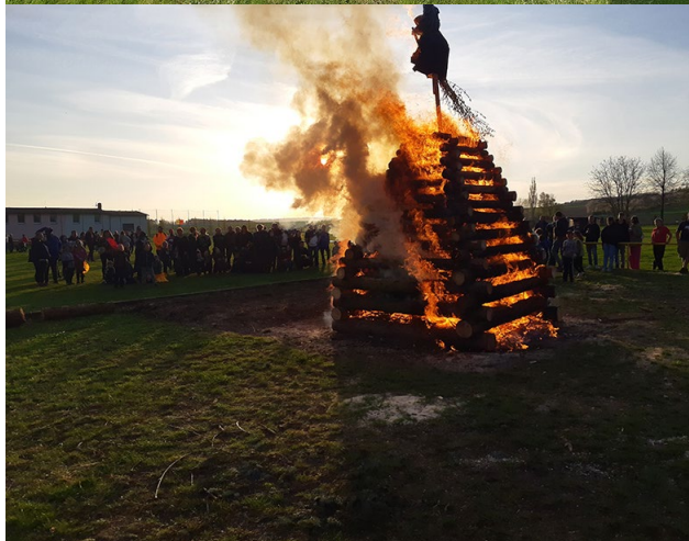
Dolanská Míle (4. 6. 2022)