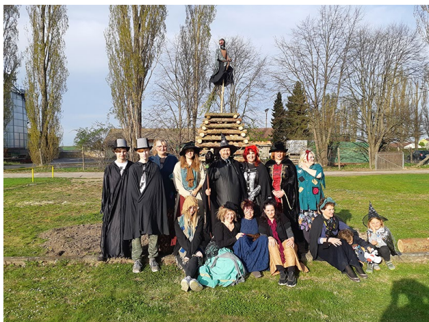
Čarodějnice (30. 4. 2022)