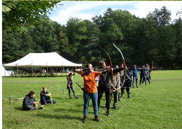
Švestkobraní (9. 10. 2022)