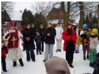
Dětský karneval (8. 3. 2009)