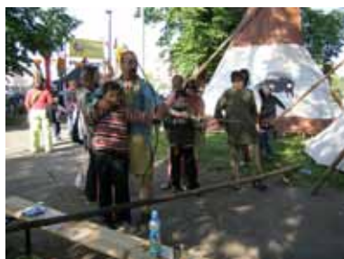
Říkovský líňák (26. 6. 2009)