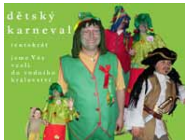
Zbubnukruh (20. 3. 2009)