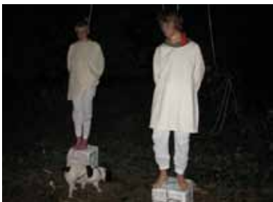
Draci nad vesnicí (9. 10. 2009)