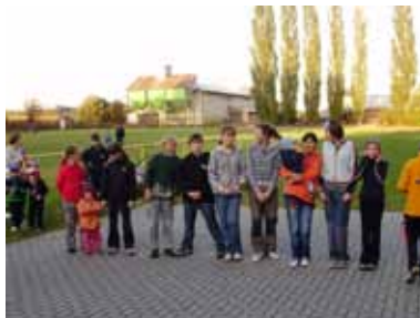
Kurz ind. řemesel (21. 11. 2009)