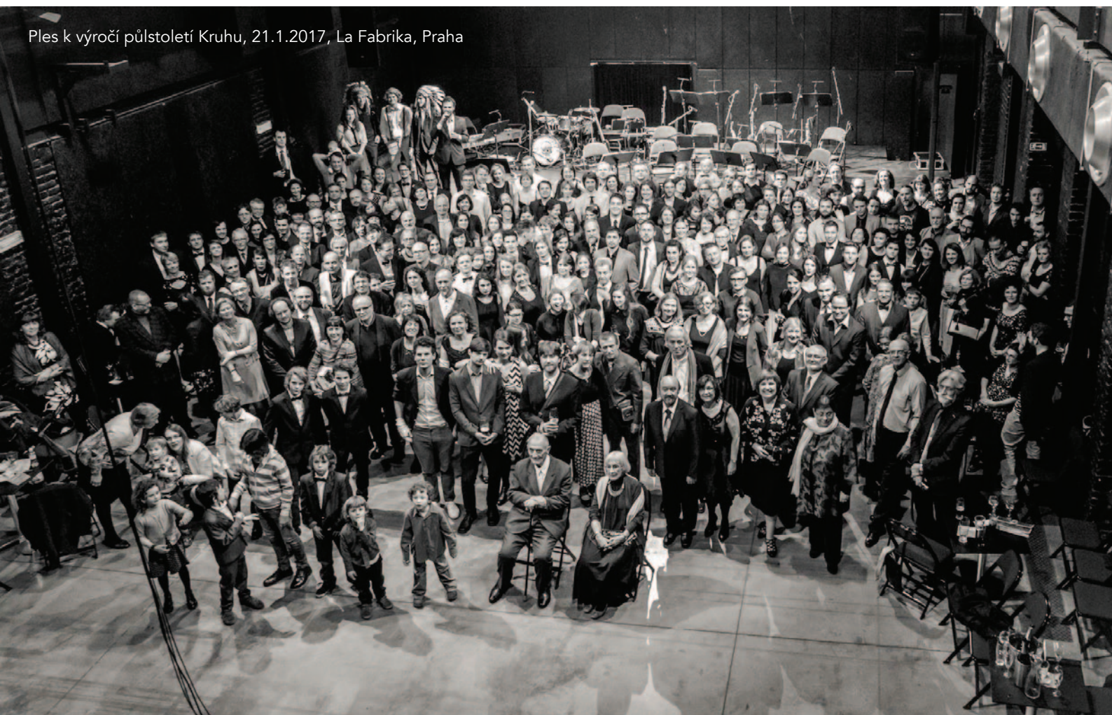
Ples k výročí půlstoletí Kruhu, 21.1.2017, La Fabrika, Praha