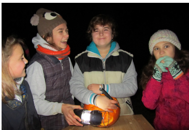
Haloween (4. 11. 2016)

Kmenové schůzky se v roce 2016 odehrávaly jak na naší základně na Zátocce, tak i v prostorách klubovny nebo sokolovny v Dolanech. Mezi netradiční patřil výlet do Aquacentra v Hradci Králové, oslava Haloweenu na Sroubence či schůzka věnovaná pletení z pedigu. Závěrečnou vánoční schůzku členové kmene oslavili na noční prohlídce ZOO Dvůr Králové nad Labem.