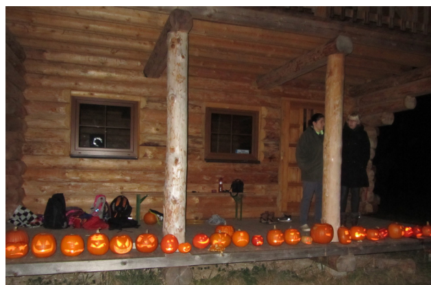
Pedigová schůzka (25. 11. 2016)