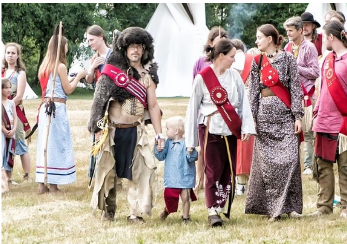
z táboření na Kosím potoce