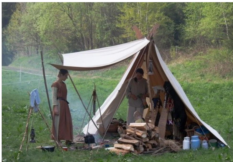
na Setkání rodinných kmenů