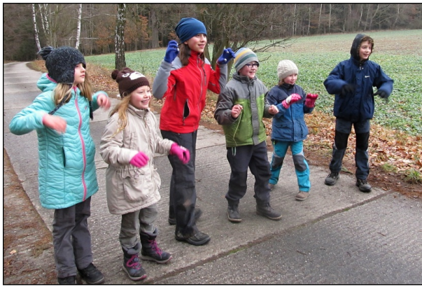
13. 1. akce káň