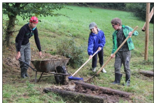
15. 9. práce pro přírodu na Jerynu