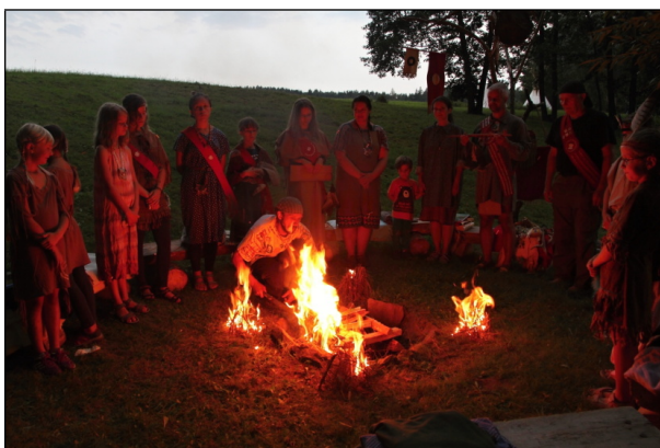
srpen letní táboření kmene Otyókwá (106 sněm)