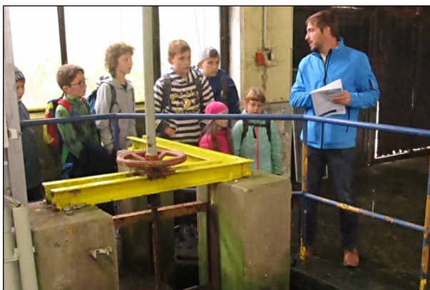
1. 11. exkurze do čistírny odpadních vod