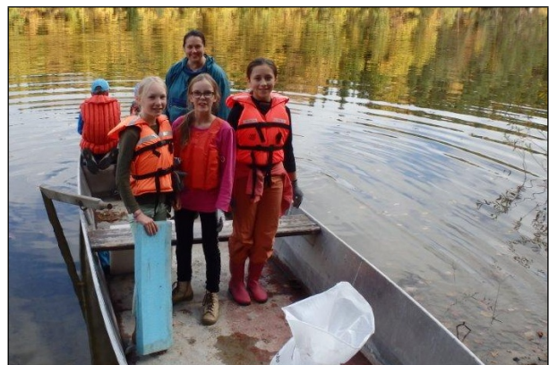
23. 5. úklid Římovské přehrady