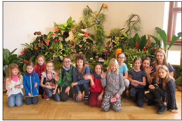
18. 2 výstava orchidejí v Jihočeském muzeu