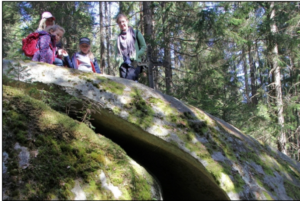
7. 4. výprava na Medvědí horu