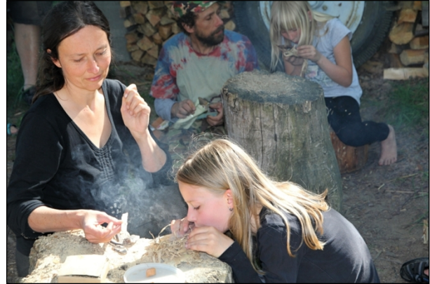
4.-6. 5. táboření na Jerynu