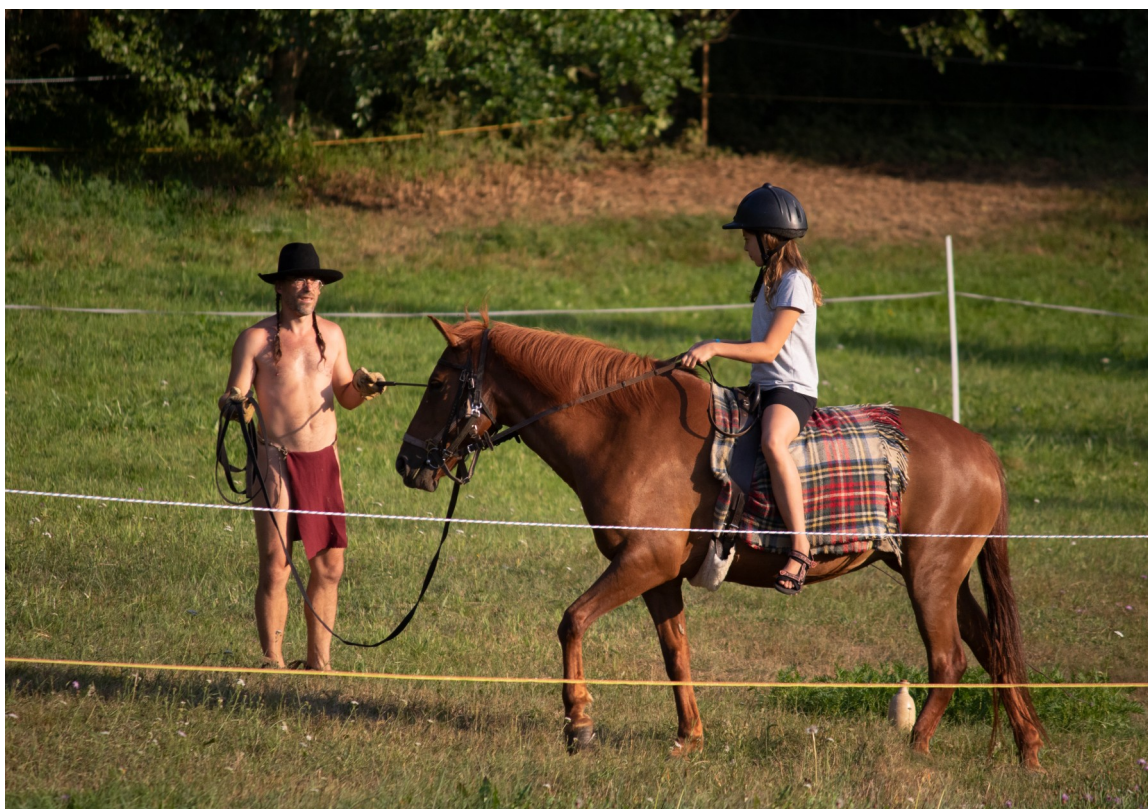
z táboření na Kosím potoce