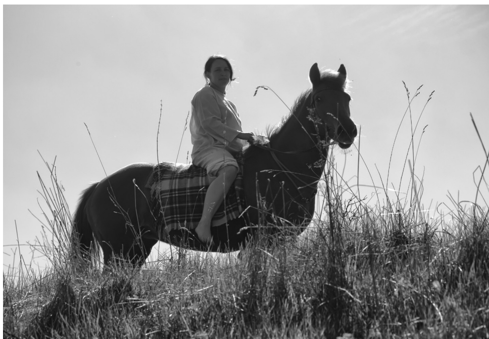
na Setkání rodinných kmenů