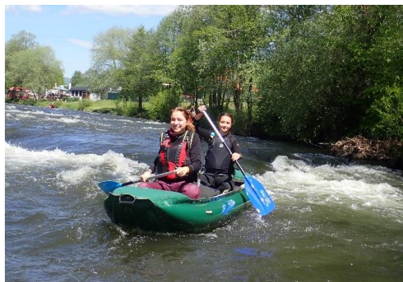
Vodácké putování – Hron