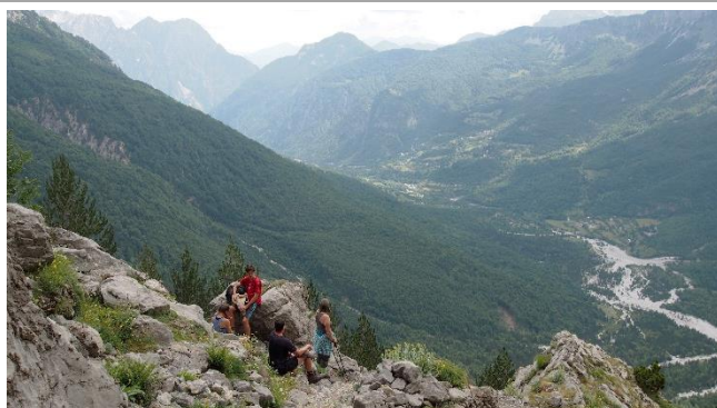
Do Země orlů (Albánie, Černá Hora)