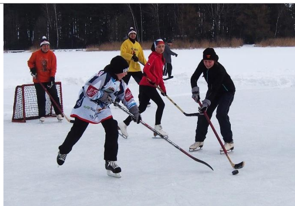
Velký hokej na Bobřím hradě