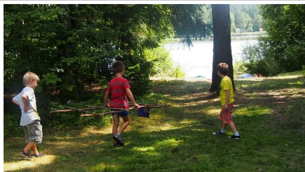
Kmenový tábor na Bobřím hradě – brigáda, tábor pro děti