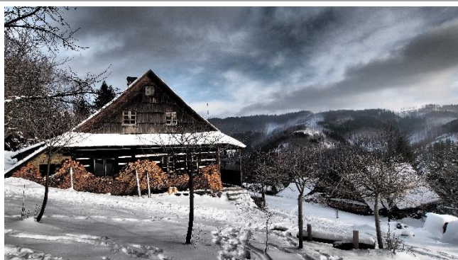
Silvestr na Kyčeře