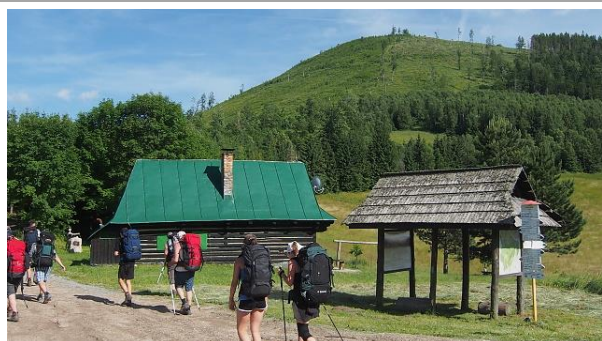
Putování Muráňskou planinou