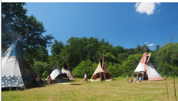
Tábor LLM - Kosí potok