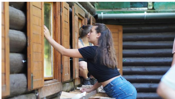
Tábor a brigáda Bobří hrad