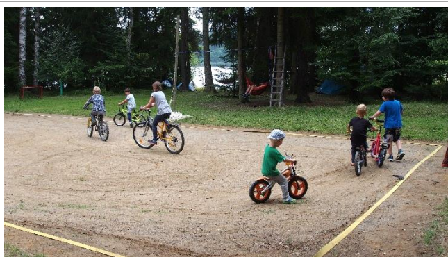
Kmenový tábor na Bobřím hradě – brigáda, tábor pro děti