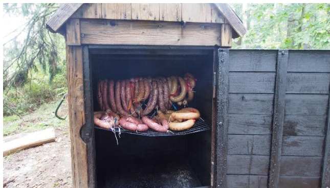
Klobásová výprava na Bobří hrad