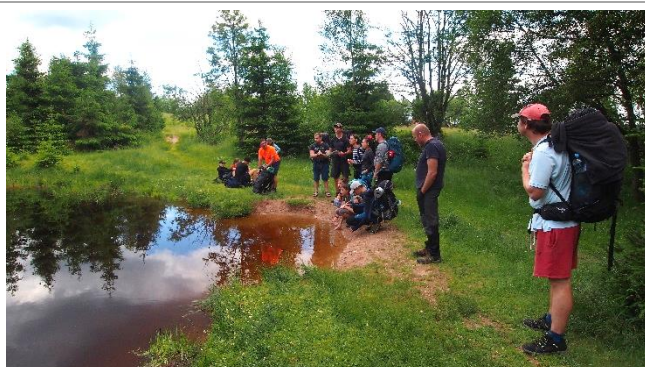
Letní puťák po Krušných horách