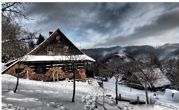
Zimní prázdniny na Kyčeře