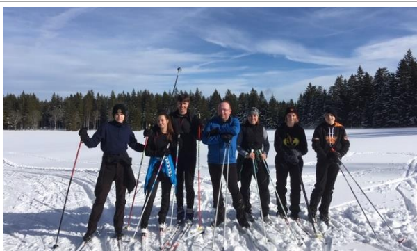
Jarní prázdniny na Šumavě