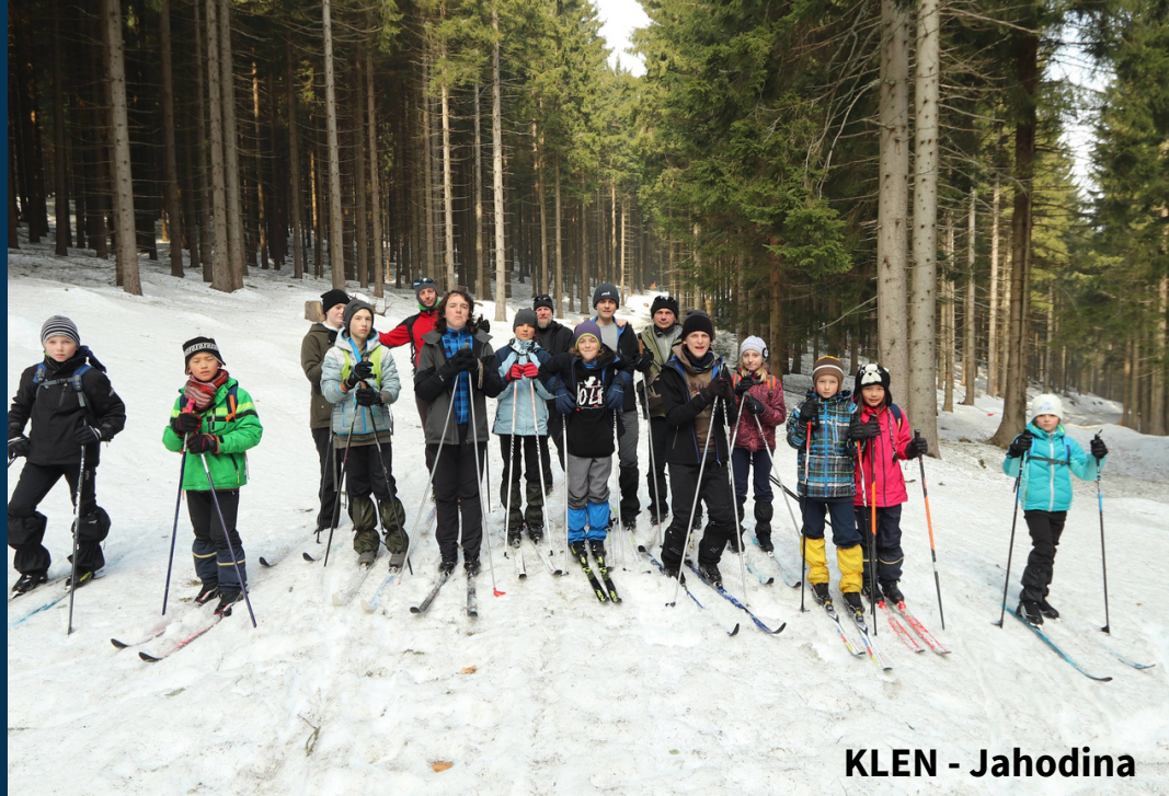
KLEN - Jahodina