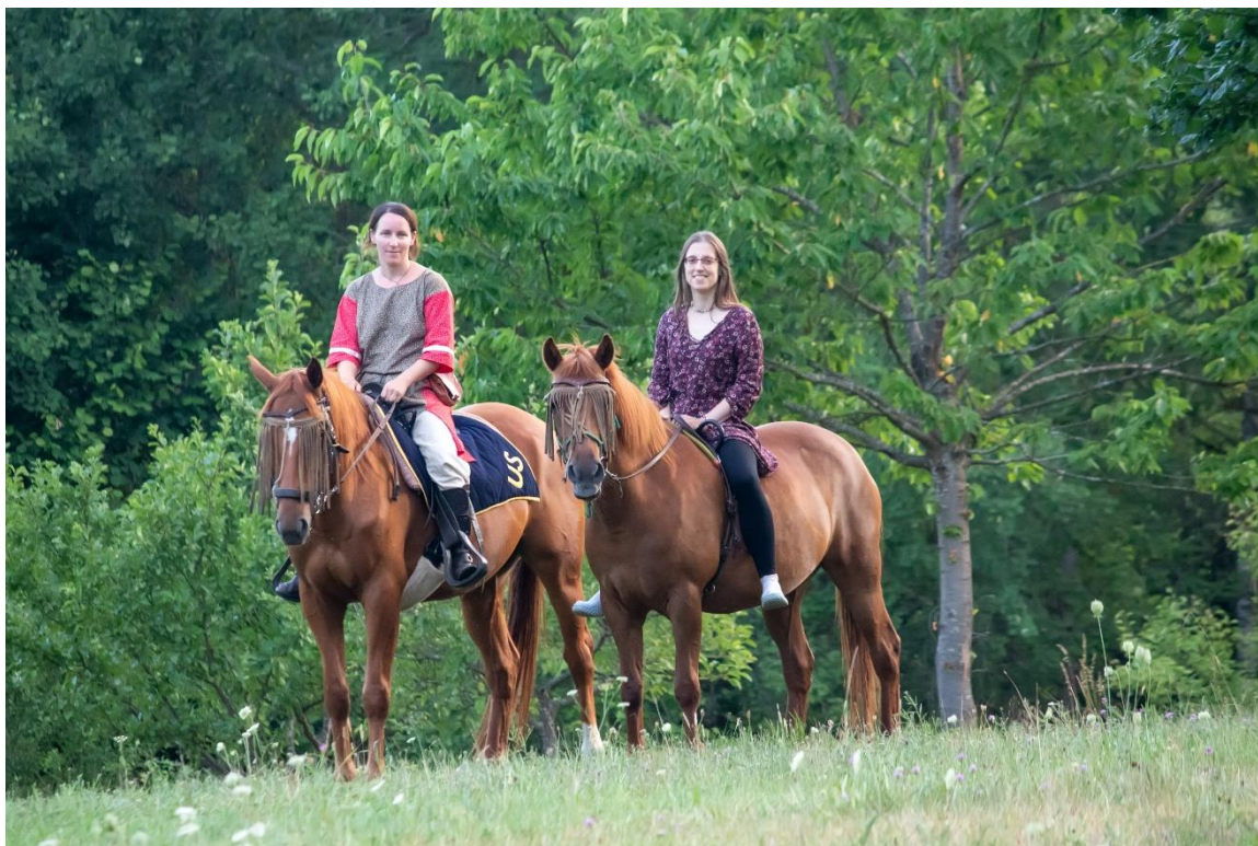
z táboření na Kosím potoce