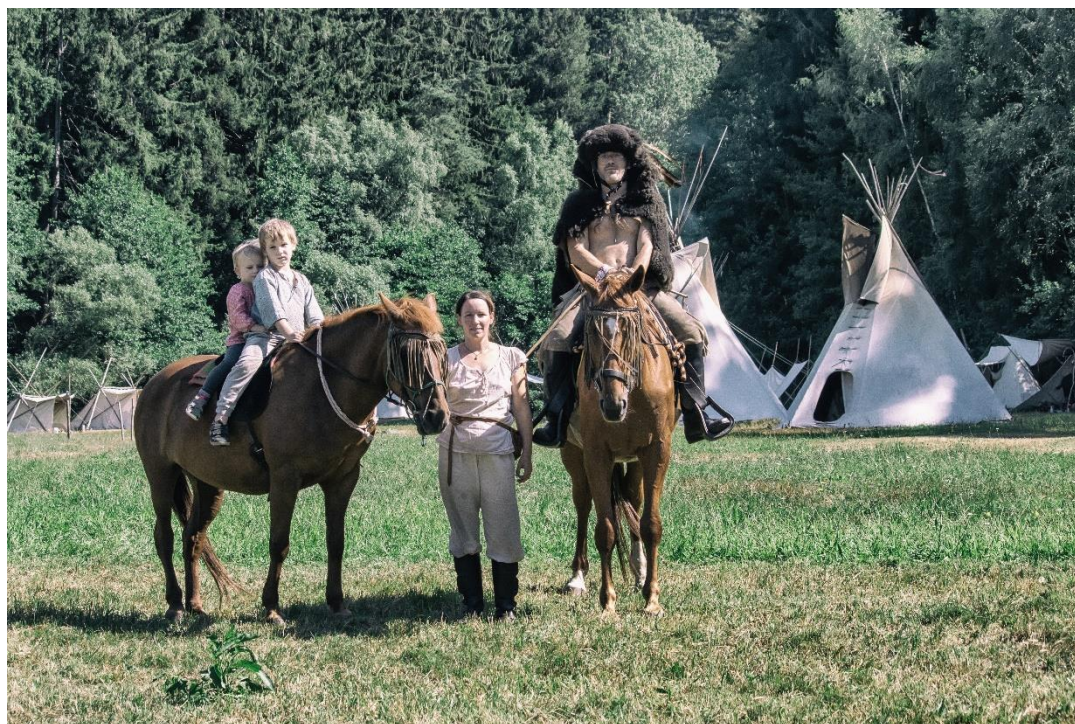
z táboření na Kosím potoce

Člen kmene – Yučikala je členem ÚROP LLM a současně i náčelnictva LLM.