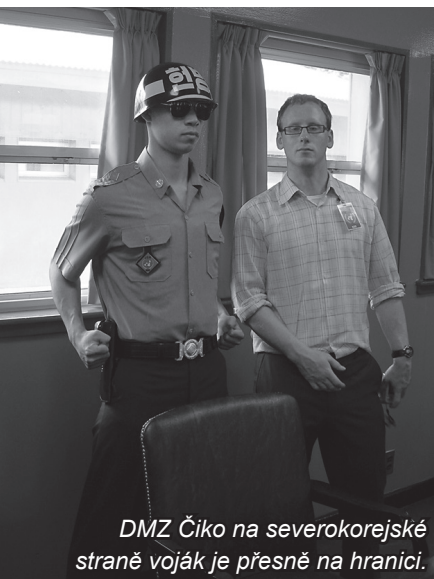
DMZ Čiko na severokorejské straně voják je přesně na hranici.

nesměli mít nic, ani sluneční brýle – to by prý mohlo z dálky vypadat, že držíme zbraň. Nesměli jsme dělat jakékoliv rychlé pohyby, ani gestikulovat rukama.