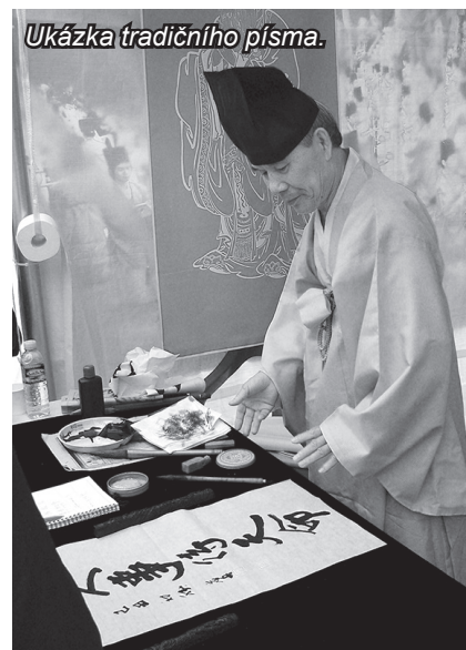
Ukázka tradičního písma.

Neslušné je smrkat. A to dost – chodí se kvůli tomu na toaletu. Naopak, když někdo chrchle