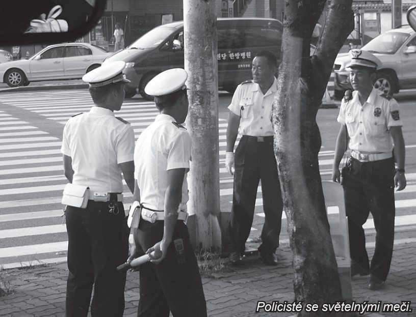
Policisté se světelnými meči.

byl já, abych šířil osvětu. Doslova každý zná Prahu a to z velmi kuriózního důvodu. Korejci totiž natočili telenovelu „Milenci v Praze“, která byla o tom, že do Prahy přijeli jeden Korejec a jedna Korejka, hned na letišti je okradli a zmlátili, ale díky těmto nesnázím osudu se ti dva do sebe zamilovali. Z celé série se v Praze natočily jen první dva díly, zbytek byl dotočen v Soulu. Telenovela se stala velkým hitem a každý se chtěl na vlastní oči podívat, jak to v té Praze vypadá. Na základě těchto požadavků korejská vláda zřídila přímý let Praha–Soul, který trvá asi 11 hodin. Dodatečně děkujeme.