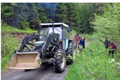
Brigáda na Kosím potoce