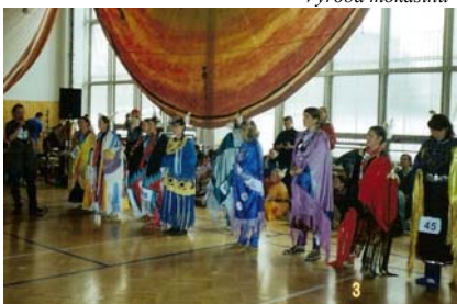
Soutěž v indiánském tancování