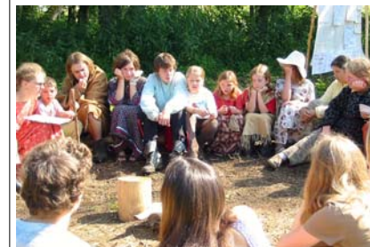
Na táboře kmen Sacagawea