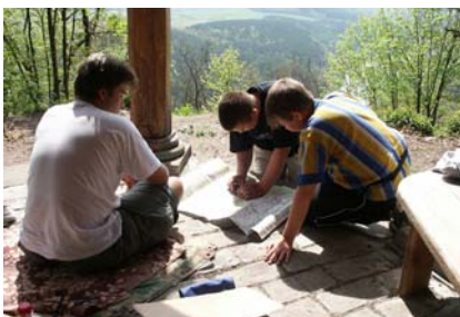
Orientace na mapě – Lesní běh