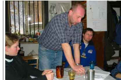
Náčelnické zkoušky - zdravotěda

Woodcrafterské centrum umístěné v klubovně kmene Walden v Dejvicích slouží pro členy LLM i pro veřejnost. Jednou týdně je zde otevřen obchůdek s věcmi souvisejícími s činností LLM (knihy, časopisy, kůže, korálky, dekrety...). Je zde bohatá veřejnosti přístupná knihovna s woodcrafterskou literaturou (příroda, zálesáctví, přírodní národy, filozofie...). Dále je woodcrafterské centrum využíváno jako prostor pro různá setkání – přednášky Indian Couralu (v 1. polovině roku 2004), cestopisná promítání atd.