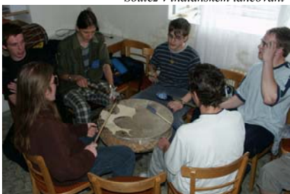
Výuka indiánských písní