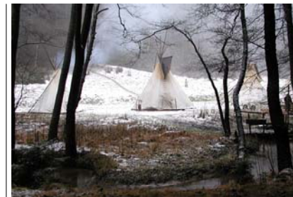
Zimní táboření Vápno u Mnichova Hradiště

Kmeny kromě táborů organizují krátkodobé (víkendové a jednodenní) akce během roku. Tyto akce navazují na jejich celoroční činnost. Kmeny pořádají pro své členy schůzky většinou jednou týdně a 1-2x za měsíc krátkodobou akci. Další činností jsou různé kratší tábory o zimních prázdninách či o velikonočních.