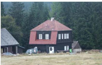
Ubytovna před rekonstrukcí