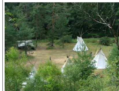
Tábořiště - Horní Hradiště u Střely