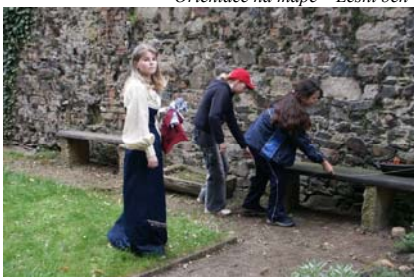
Křivoklát - Tajemství Engendera