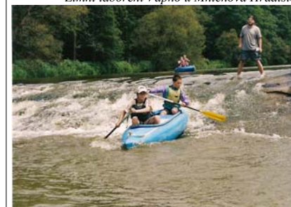
Kmen Ťapáč na vodě