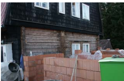
Probíhající přístavba a rekonstrukce