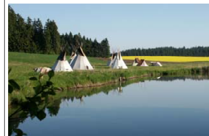
Tábořiště Malý Walden