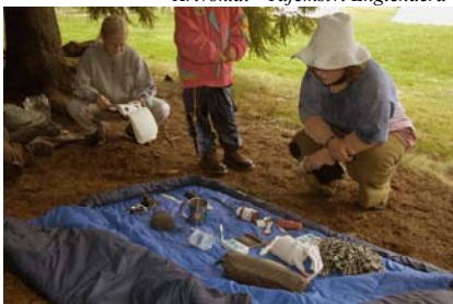
Kiwendotha - Kimova hra