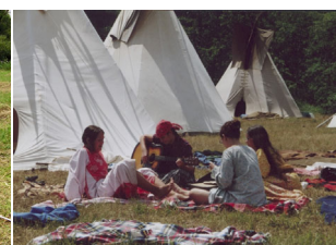
táborová letní pohoda

Osvětim – 1.10. 2005 návštěva bývalého koncentračního tábora v Polsku (bez dětí)