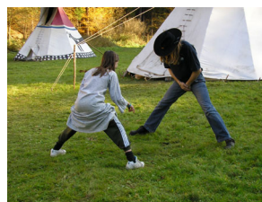
nová zábávaná hra