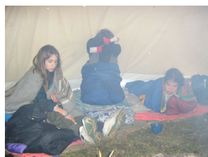
ráno se nikomu nechce ze spacáku

Podzimní táboření – 27.10 – 30.10. 2005 I přes chladnější počasí jsme zatábořili společně se 4 dalšími kmeny u Losin