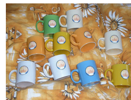
hrnky se znakem kmene

Wanagi Oyate je samostatným právním subjektem sídlícím v Kolíně.