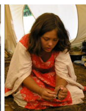
rozdělávání ohně s ocílkou