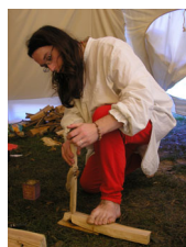
rozdělávání ohně třením dřev