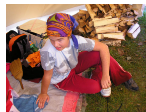
před zahájením hry