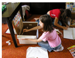
příprava na tábor: výroba bedny do týpí

Tábor – 2.7. – 17.7. 2005 tábořili jsme společně s dalšími kmeny na Kosím potoce