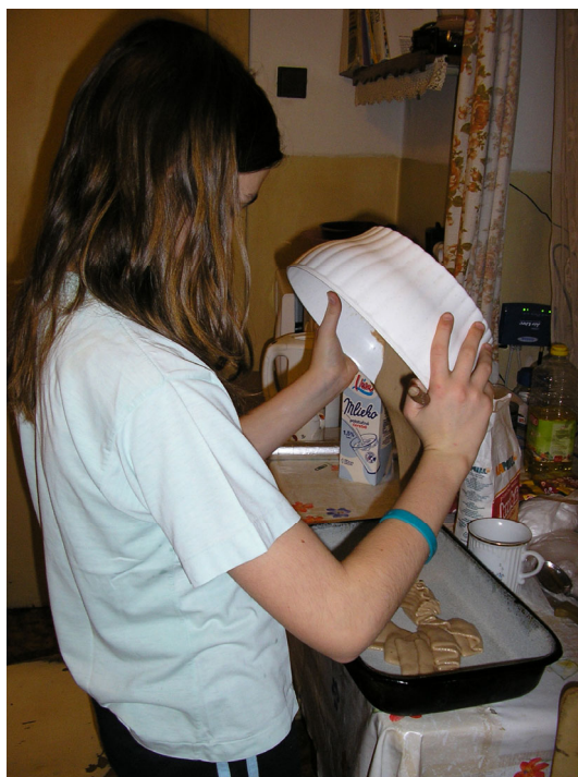
Výroba buchty na orlí pero

Kulturní referent: Lenka Vávrová Hlídá, kde je jaká zajímavá událost, na které nesmíme chybět.