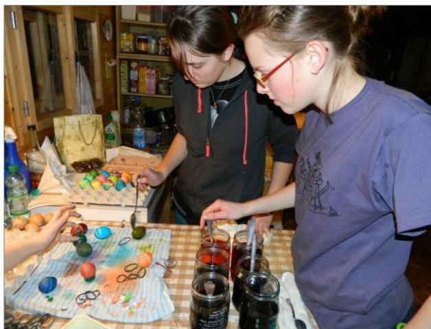
A koledníci mohou přijít!