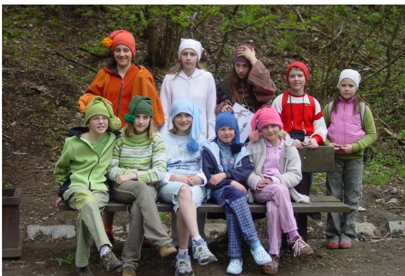
Při podzimní výpravě děti poznávají u skřítků něco dobrého ze sušených plodů