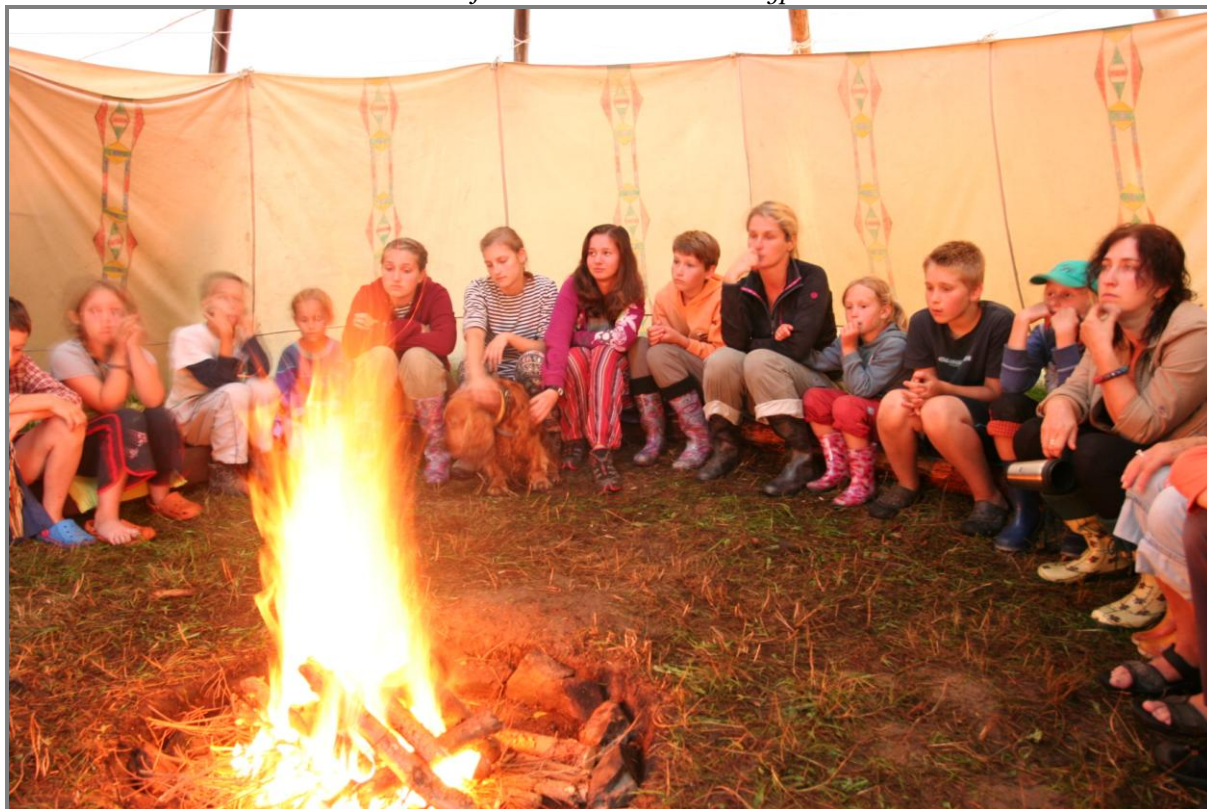
Zahájení tábora ve sněmovním týpí