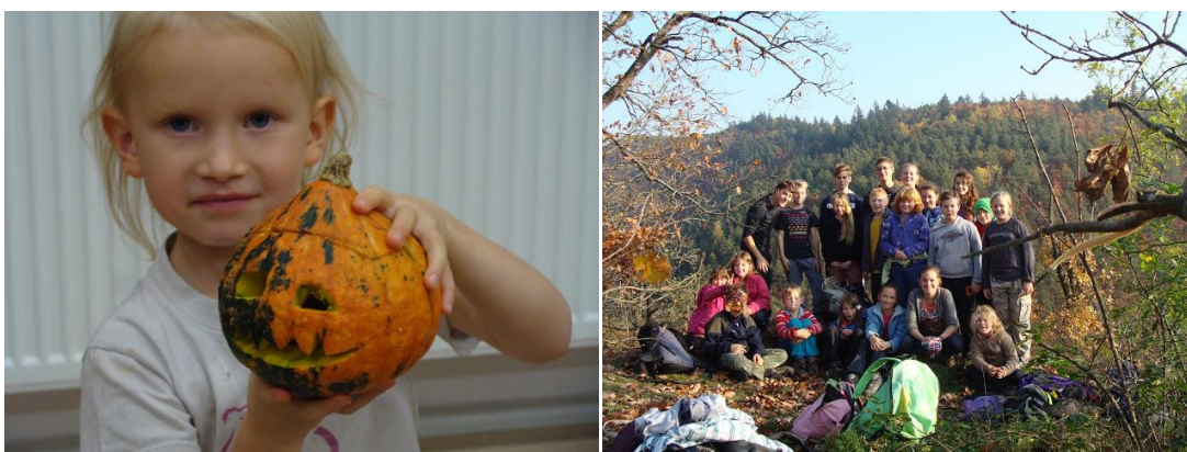
Podzimní výprava v krásném prostředí řeky Oslávky