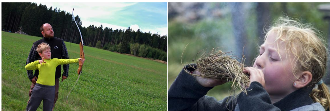
Poslední z Velkých her - Kiwendotha na Malém Waldenu.