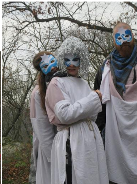
Mikulášská výprava - letos bez čertů i Mikuláše, pouze s anděly a andělským psem!