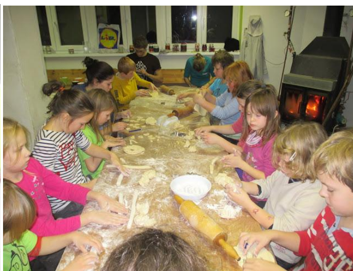
A poslední výprava roku - Vánoční. Letos se všemi dárky na N a v černé barvě.

Tím skončil náš rok 2015 S MODROU OBLOHOU