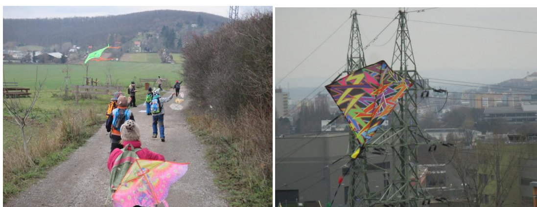
Drakiáda - málem bez větru.