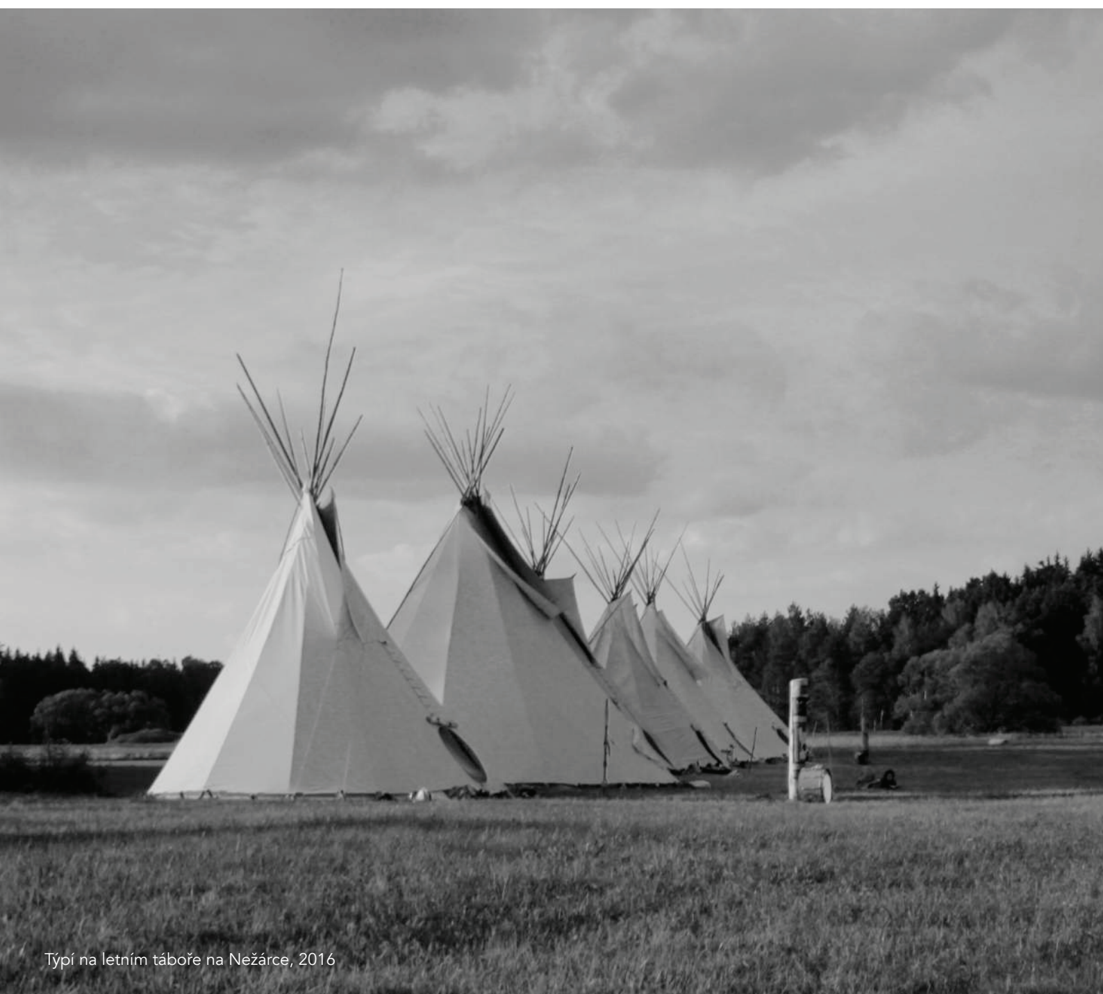
Týpí na letním táboře na Nežárce, 2016