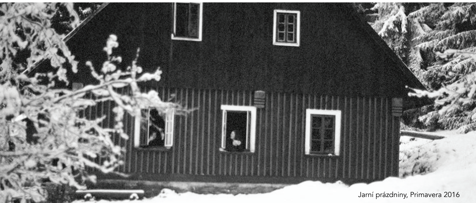
Jarní prázdniny, Primavera 2016

Rok tradičně završily dvě vánoční akce: Vánoční sněm počátkem prosince, který je oddílovou oslavou svátků na Primaveře, a Vánoční výstava, na níž děti sehraji divadla, která secvičily se svými rádci, a prodávají výrobky, které společně během listopadu a prosince vyrobili.