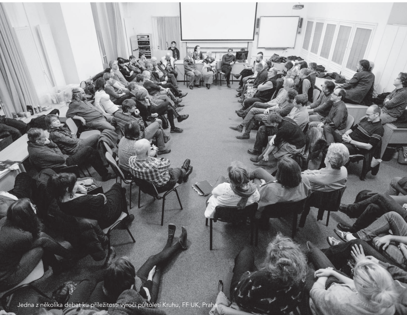
Jedna z několika debat ku příležitosti výročí půlstoletí Kruhu, FF UK, Praha

Ačkoliv se dále jedná o akci, která proběhla již v roce 2017, je třeba se o ní na závěr také zmínit, jelikož velkolepě uzavřela celý výroční rok. Třetí lednovou sobotu se totiž uskutečnil ples k půlstoletí Kruhu, který proběhl v holešovické La Fabrice a přišlo na něj opět několik stovek účastníků. Hrál se, tančilo, zpívalo a byla to krásná a důstojná tečka za tímto velikým výročím. Na plese také proběhl křest dlouho očekávaného almanachu mapujícího celou historii oddílu, knihy Půlstoletí Kruhu. Ta vznikala v průběhu posledních dvou let a podílela se na ní většina současného náčelnictva i desítky až stovky bývalých členů oddílu.