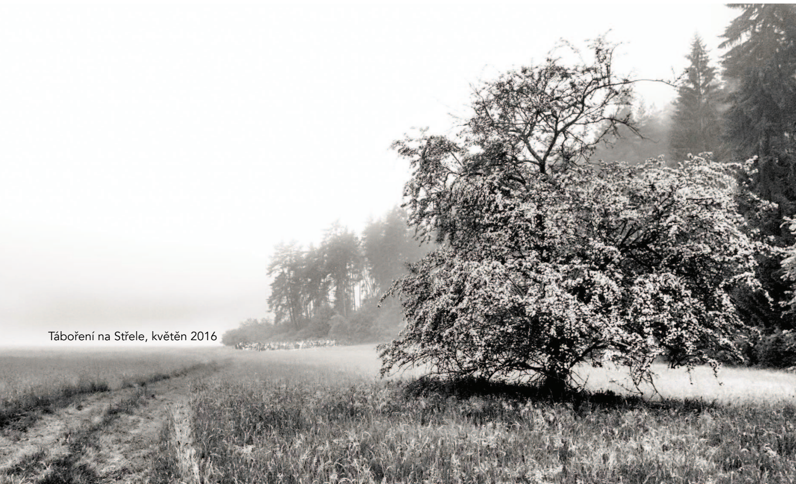
Táboření na Střele, květen 2016

První tři týdny v červenci proběhla nejvýznamnější událost roku – tábor. Tentokrát jsme jeli na staronové tábořiště na řeku Nežárku nedaleko Kardašovy Řečice, kam náš oddíl jezdil ve svých úplných počátcích, a tak jsme se rozhodli se na něj v tomto výročním roce symbolicky vrátit. Tento tábor jsme se rozhodli pojímat poněkud odlišně než předešlé a věnovat více času velebení tábořiště a tzv. vyráběcím dnům. Cílem bylo co nejvíce rozvíjet v dětech tvůrčího ducha, podpořit je ve vlastních nápadech a učit je zručnosti a znalostem lesní moudrosti. Nechávali jsme jim proto více volného prostoru, v rámci něhož se mohly věnovat nejrůznějším činnostem. Podařilo se tak sestavit velikou houpáčku, vytvořit krásný totem, splout řeku na vlastním voru, vykopat přírodní studnu, a dokonce postavit pec na chleba a ten v ní následně upéct. Kromě toho si děti dle vlastní fantazie zdobily a vylepšovaly svá teepee, učily se malovat, šít, vyřezávat ze dřeva a spoustu dalších drobných ručních prací. Samozřejmě ale v programu tábora nechyběla ani velká čtyřdenní hra, olympiáda, nacvičování divadla či hraní softballu a lakrosu.