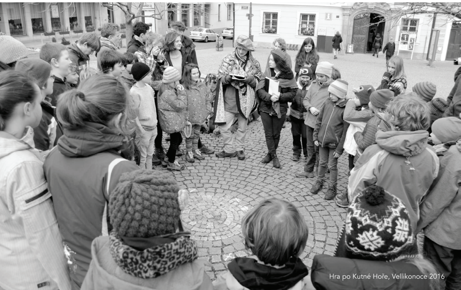
Hra po Kutné Hoře, Velikonoce 2016

Velikonoce jsme všichni společně strávili na středověké tvrzi v Malešově nedaleko Kutné Hory. Charakter dobově zařízené tvrze všem učaroval, i přes některé nepříjemnosti s tím spojené, především ukrutou zimu, která v nevytápěných prostorech koncem března panovala. Vedle výletů a hraní různých her jsme se samozřejmě věnovali velikonočním tradicím, holky malování vajíček, kluci pletení pomlázek.