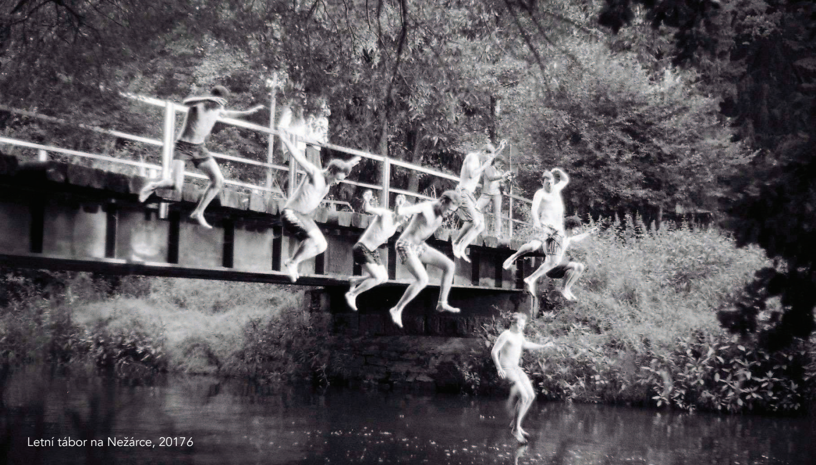
Letní tábor na Nežárce, 20176