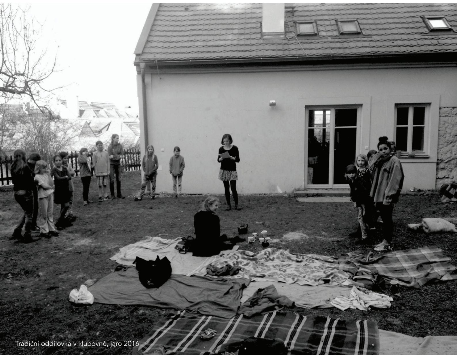
Tradiční oddílovka v klubovně, jaro 2016

Na začátku září proběhla v klubovně Zahradní slavnost, na které jsme se představili novým dětem a jejich rodičům, pohovořili o chodu oddílu a plánovaných akcích a sezvali nové ratolesti k přihlášení se do našich řad. V průběhu celého roku v klubovně také bydlela správkyně, bývalá členka oddílu Adéla Škorvagová. Status hospodáře jsme se po dlouhých debatách rozhodli v současné době zrušit, neboť je pro oddíl po finanční i kapacitní stránce nevýhodný.