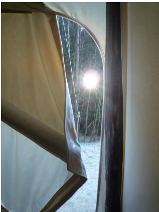
Slunce v novém roce