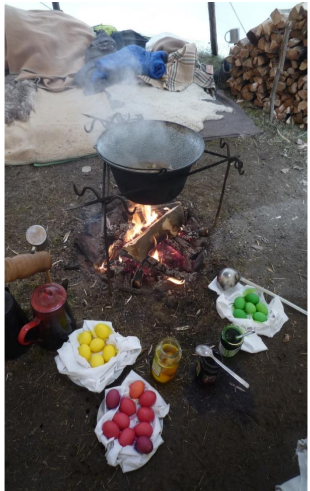
Upletli jsme pomlázky a barvení vajec na ohni byla velikonoční nálada táboření.