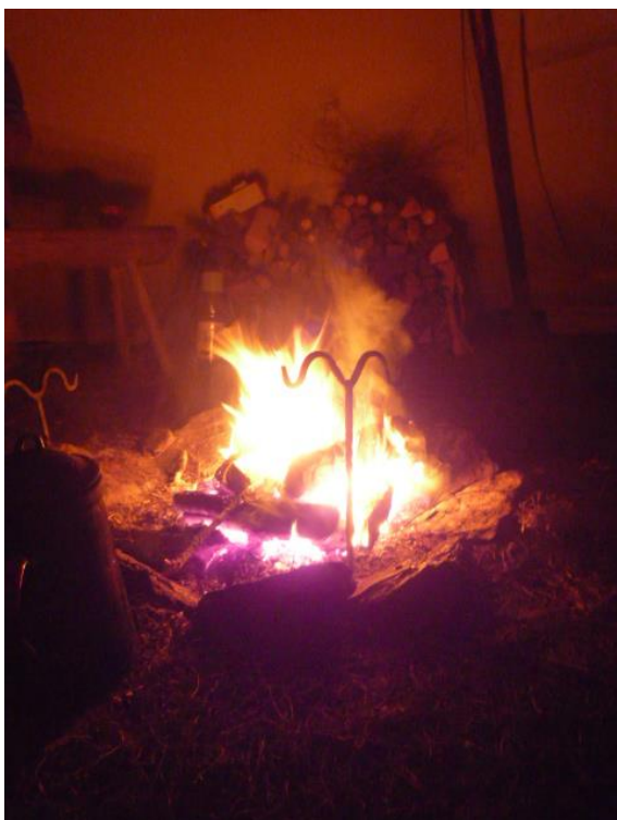
Ohnivcovy poslední ohně v roce