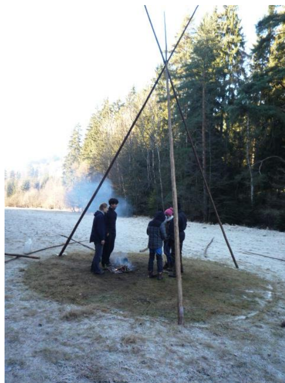
Týpí kruh ve zmrzlé půdě na Nový rok