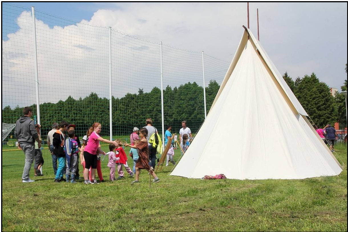
Den dětí ve Velešíně (stan typu Zubřík byl zapůjčený od J. Růžičky)