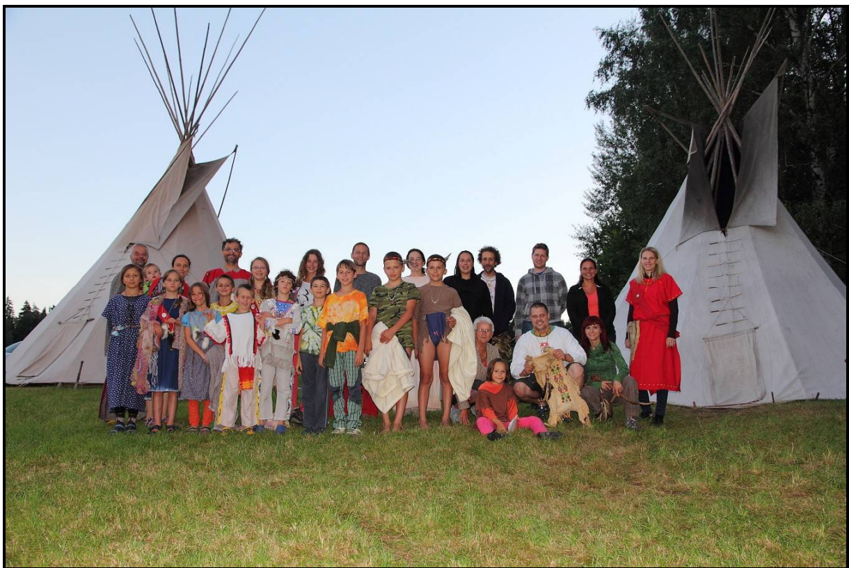
Účastníci letního setkání k 25 letům kmene, které proběhlo v rámci letního tábora.