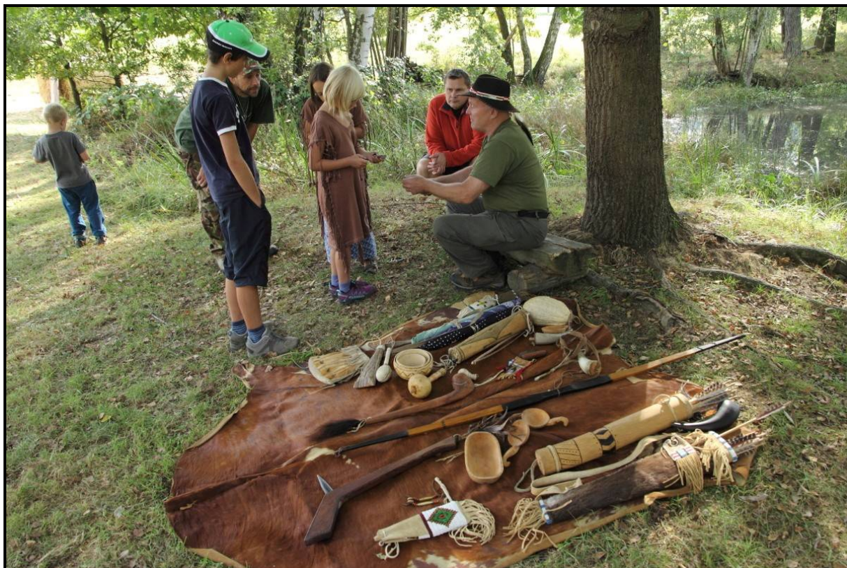
Indiánské léto - den otevřených týpí