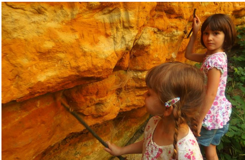
Jedna ze schůzky