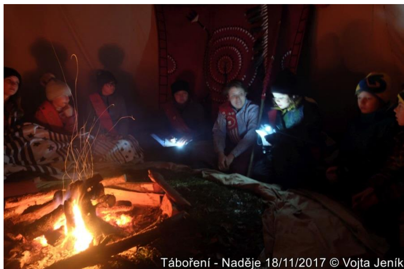
Táboření - Naděje 18/11/2017

Po pozdním sobotním obědě, který vařili Jestřábi (Jestřábi nám vařili všechny večere a sobotní oběd), jsme vyrazili na prohlídku náhonů v okolí. Po počátečních peripetiích jsme našli jeden u bývalého Neumannova Mlýna a cestou zpět se podívali i do dalšího u Kaple sv. Antoníčka. Z výletu jsme se vraceli daleko za tmy a bylo jasné, že večerní sněm rozhodně nezačne v osm, jak bylo v plánu.