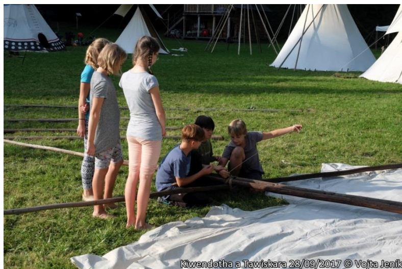
Kiwendotha a Tawiskara 28/09/2017 © Vojta Jenk