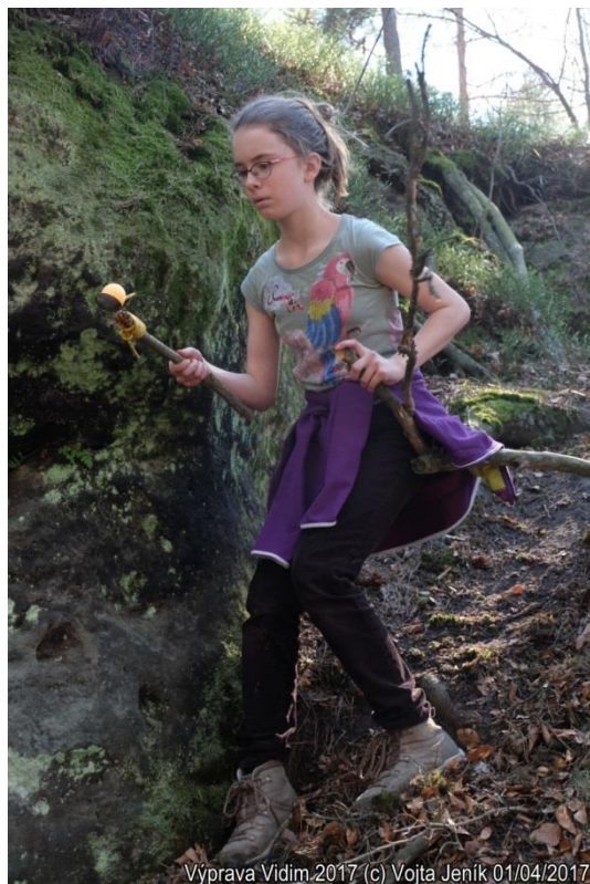
Výprava Vidím 2017 01/04/2017

Sobotní výlet nebyl dlouhý co do nachozených kilometrů, ale možná i o to víc jsme si ho užili. "Vylezli" jsme na pískovcovou skalku nad údolím a kochali se rozhledem, usídlili jsme se nahoře na vyhřáté louce, kde foukal svěží jarní vítr, zahráli si tam Pahorek a lakros (dětem to neskutečně šlo!) a dali si oběd. Našli jsme pískovcový mostek, domeček ve skále a převisy s ohništi, zazávodili si s míčkem na lžici na klacku v náročném terénu. Naučili jsme se poznávat nové stromy a jarní kytky. Večer jsme nachystali dřevo na oheň, dali si večeři a připravili se na sněm.