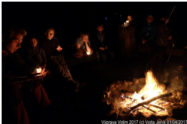
Výprava Vidím 2017 01/04/2017

Strážcem wampumu neboli hospodářem byl jednomyslně zvolen Vojta, protože je nejstarší a bezesporu nejzodpovědnější.