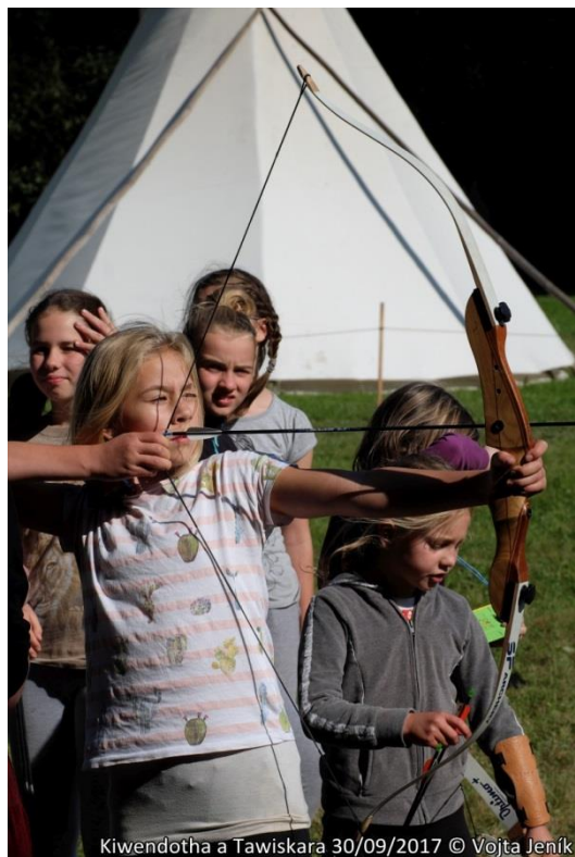
Kiwendotha a Tawiskara 30/09/2017