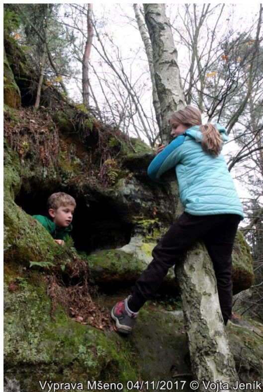
Výprava Mšeno 04/11/2017 © Vojta Jeník

Bludiště, kde jsme sbírali papírové koule a utíkali před zlými strážci (Markátkou, Vojtou a Rózou). Bludiště sice není velké, má ale spoustu zákoutí, takže docela trvalo, než jsme všechny koule našli.