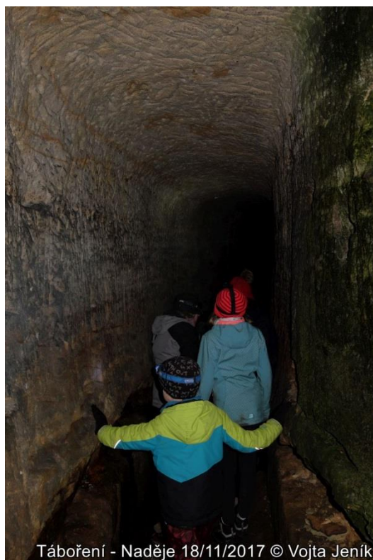
Táboření - Naděje 18/11/2017

nám zmrzl zbytek čaje v kotlíku. Když jsme se konečně před polednem dostali ven, zahráli jsme si několik her. Nejprve jsme trénovali lakros a pak hráli s Jestřáby ringo vybiku. Jestřáby hrají totiž lakros jen za trest.