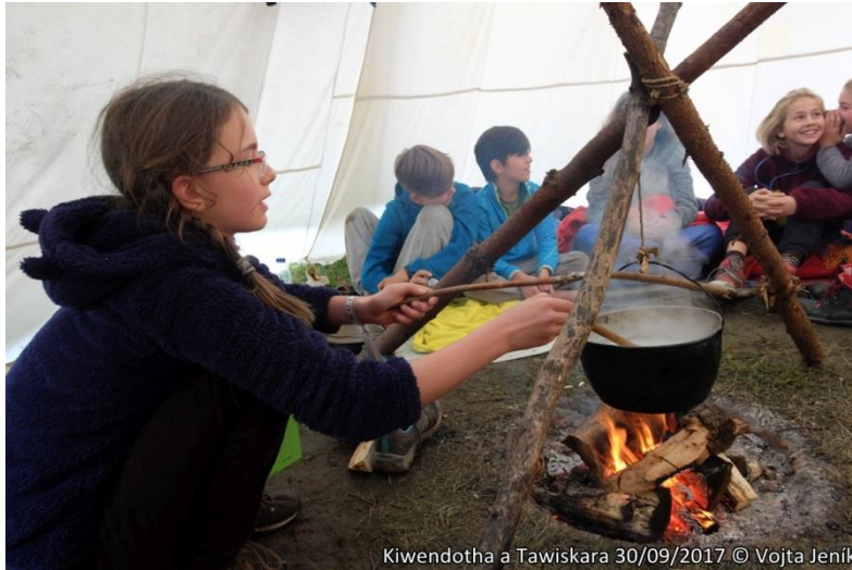
Kiwendotha a Tawiskara 30/09/2017

dokonce počítat góly a skončili jsme, až když nebylo vidět od branky k brance. Večer jsme četli pohádky a hráli na kytaru a zpívali, chřestili a bubnovali.