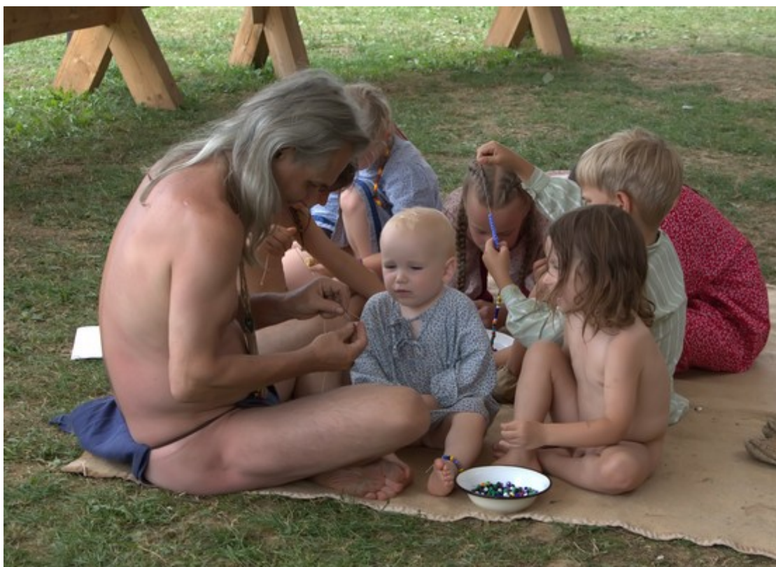
z táboření na Kosím potoce