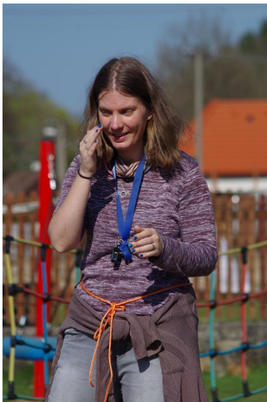
Při poznávání hradu Roštejn