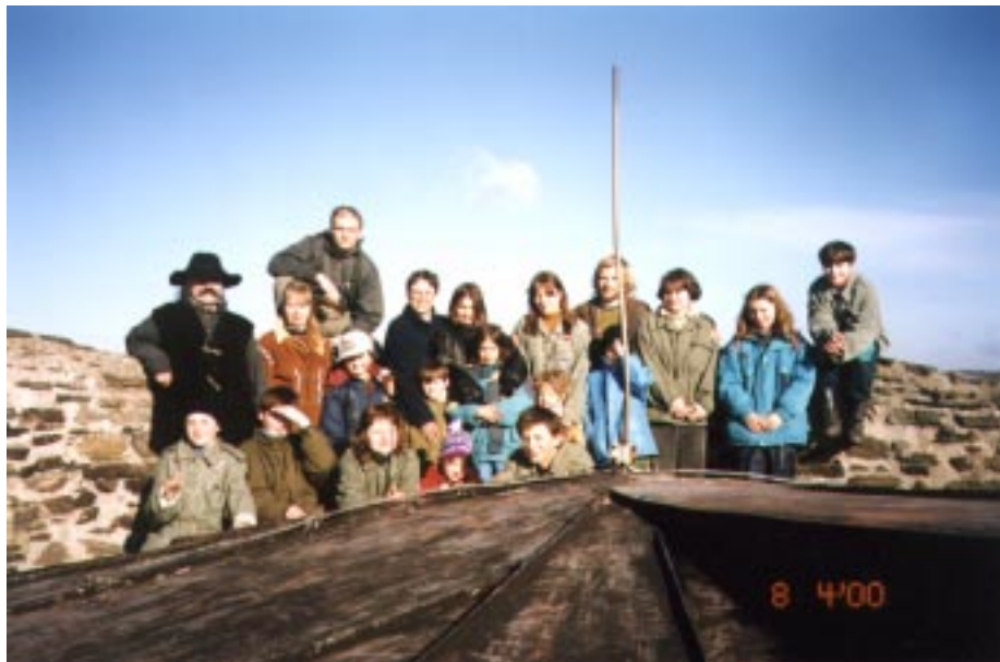
Při ranní písni na věži hradu Svojanov.