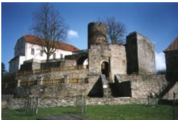
Hrad Svojanov - pohled ze zahrad