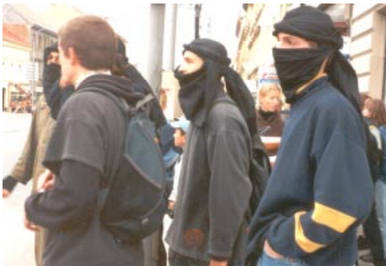
Beduíni, meduíni, buduíni a jiní....

Celá hra začínala pohádkou o okradeném sultánovi. Ten musel podle plánu najít své ukradené peníze, které chamtivý vezír poschovával po městě. Děti dostaly 40 očíslovaných fotek a mapu s prázdnými kroužky, do kterých musely dopsat čísla fotek podle umístění. Bylo 9,30h a bloudění mohlo začít. Jedini, kdož stáli v cestě úspěchu byli černí beduíni, kteří dávali trestné body za nápadné chování.