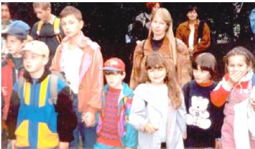
Účastníci Brněnského bloudění při vyhlásování vítězných družstev

A nutno podotknout, že naše dívky se jich doopravdicky bály, i když je okamžitě po startu překřtily na „meduíny“, což znělo docela „medově“. Jako bodyguarda s sebou vláčely mě, zatímco Vlk se věnoval fotografické dokumentaci celé akce.