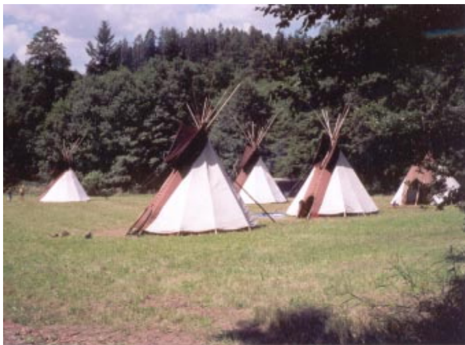
Tábořiště XII.LEV u Višňového potoka na Kořenecku