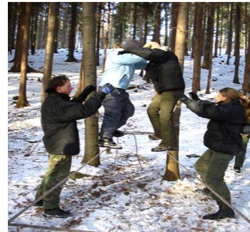
Na táboření nebyla nouze o netradiční sportíky, které prověřily všechny zúčastněné.

No, co dodat. Zase se všechno podařilo a většině se domů fakt nechce. Na nádraží jsme při rozloučení zabrali čtvrtku vestibulu (aby ne, když nás tam bylo přes 40!) A pak už si děti rozebrali maminky, my jsme se taky rozebrali a už se těšíme na další akci.