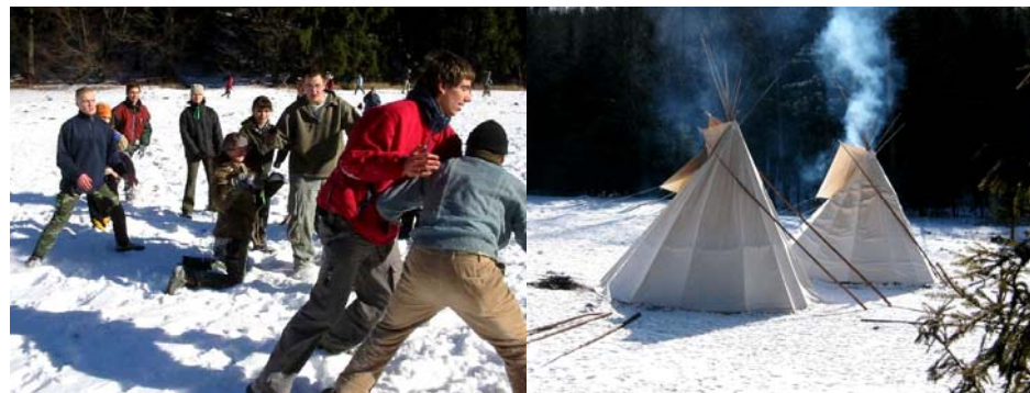
Urputné boje při tradiční talířovce