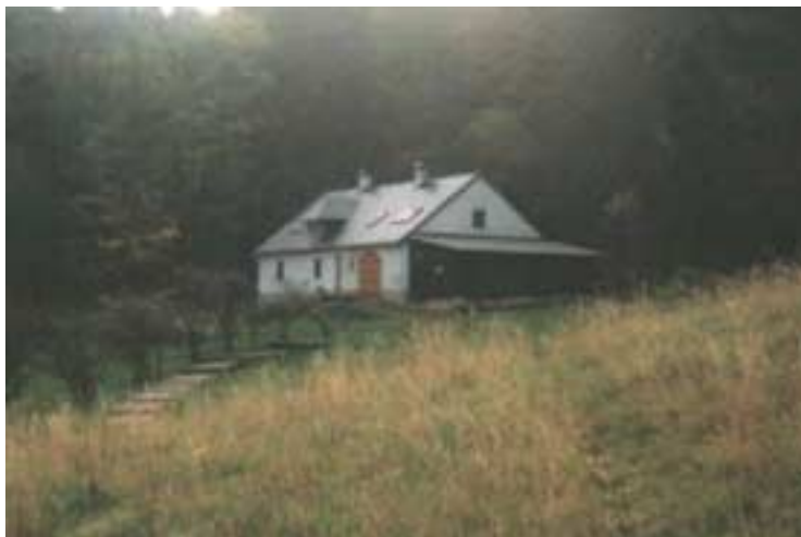
Tak to je Hájenka, ve které jsme spali