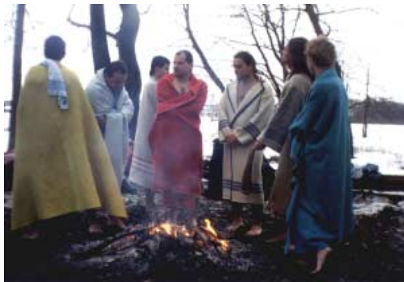
Po obřadu jsme se dosušovali okolo ohně

„Ševelící úsvit dopověděl příběh vlastního života a ztichl. Indiáni se v těsném prostoru parní lázně začali zvedat na nohy a toáře všech se obracely k vysokému bílému muži, kterého mezi ně zavedl osud. Z jejich výrazu bylo znát, že ho mají rádi. Přijal jméno, které mu dali, zvykl si na jejich skromný způsob života a vlastně se stal Indiánem. Často se vydával na daleké cesty a pokaždé byl dlouho pryč. Pak se ale znovu nečekaně objevil a Indiáni, vždy šťastní, že ho mají zase zpátky, se kolem něho shlukli a svým dobromyslným žertováním a smíchem se ho snažili rozveselit. Příběh, který právě skončil, byl poslední, v přítomné parní lázně už nebylo co vyprávět. Kameny rozpálené ohněm vychladly. Indiáni se naposledy rozesadili na podlaze z cedrových větví a modlitbou vyjádřili své díky duchu parní lázně. Pak odhodili chlopeň dveří a vyšli ven do ranního úsvitu. Nazí seběhli ke břehu bystriny a vrhli se do ledové vody. Když se očistili od prachu a kouře, vystoupali zpátky po úbočí svažujícím se k vodě a na jeho hraně zůstali stát zpříma jako sochy, s tváří obrácenou ke slunci, které pomalu