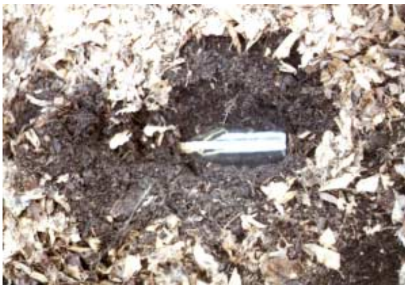
Láhev s listinou