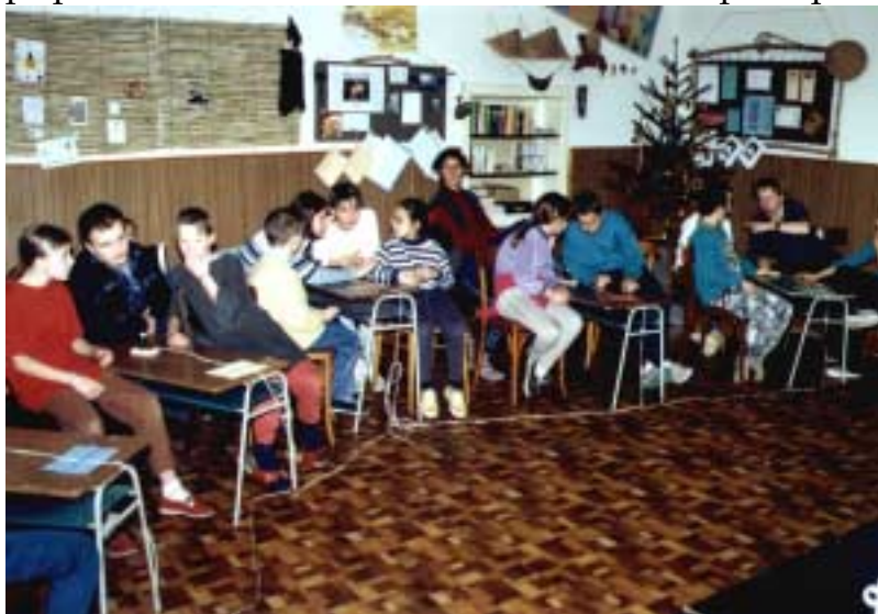
Soutěžící ke hře Hip, Hap, Hop jsou připraveni

floorball, pak chvíli fotbálek, viseli jsme na kruzích, skákali přes kozu, šplhali na laně a ve 14.00 hodin jsme byli úplně zničení. Pak nás opustili Dávy a Blecha, kteří šli do klubovny připravovat večeri a hlavní hru večera – Hip, Hap, Hop. My ostatní jsme se vydali do lesa