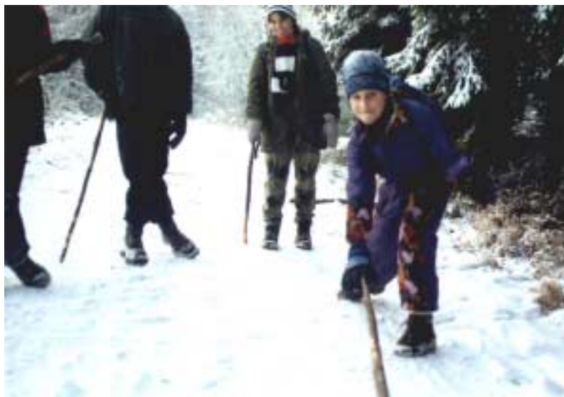
Kečup rozjíždí svého sněžného hada

Obešli jsme lom a uviděli, jak se potápěč právě škrábe ven z vody. Než stihl dojít k autu, tak už z něho opadávali kusy ledu. Raději jsme se dlouho neřvali, aby nám nebyla velká zima a vyrazili přes další zatopené lomy dál. Na našem známém místě jsme na dvě hodky zaparkovali, opekli buřtíky, trochu se ohřáli a zahráli si "Ruskou schovku". Pak jsme nabrali směr ke štole a vyrazili. Čekalo nás ale nemilé překvapení. Už z dálky bylo vidět něco co tam nepatří. Když jsme došli blíže, uviděli jsme mříž. Jak