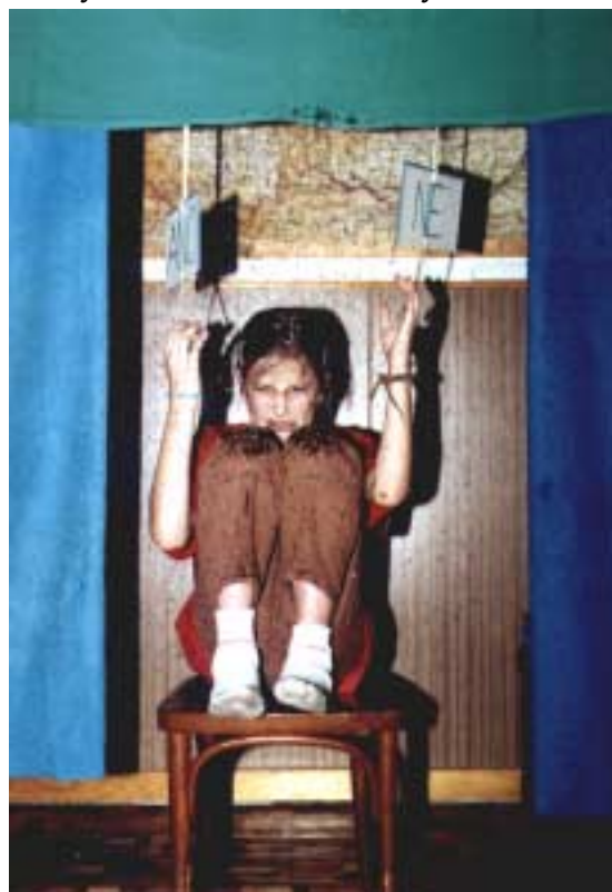
Kečup špatně odpověděla, a tak místo kuliček štěstí teče voda

na Oskarku, kde jsme nesli něco na zub zvířátkům , a taky jsme rozvěšovali krmítka. Potom jsme zase autobusem dorazili do klubovny, kde nás už čekaly řízečky a salátek a kofola. Po vydatné večeri přišly na řadu nějaké ty lidové zvyky. Rozkrajovali jsme jablko, rozlouskli jsme ořechy a jedli jsme chleba s medem. Pak jsme rozkrojili jablko na tolik dílů, kolik nás bylo u stolu a každý z nás snědl 1 kousek, abychom se zase sešli příští rok. Nakonec jsme