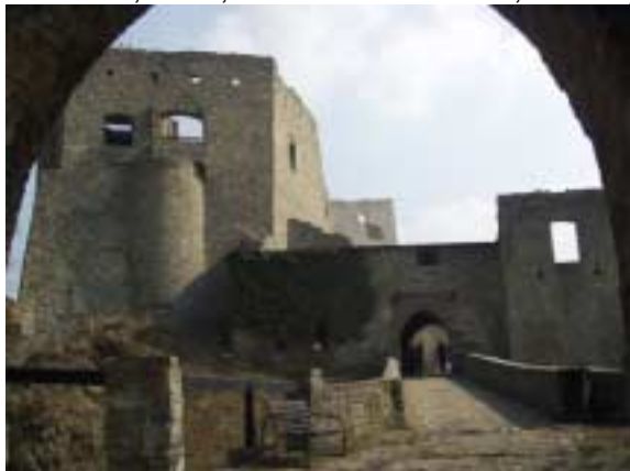
Pohled na opevnění 5 brány hradu Hukvaldy

Sraz jsme měli v pondělí 21. 4. 2003 ráno u Staňkovičů. Tam na nás holky přišli chlapi a dali nám na zadnici. Poté, co nás všechny vyšmigrustovali, tak jsme naskákali do aut a jeli za tetou Šimšovou, jelikož byla nemocná, a tudíž s námi nemohla jet, tak ji šli chlapi alespoň vyšmigrustovat. Poté odjíždíme na zříceninu Hukvaldy. Tomáš, Kečup a Eva byli velmi, velmi, velmi naštvaní, protože nemohli jen na putování po Pálavě (s kmenem). Konečně jsme dorazili na ono místo. Bylo tam velmi, velmi, velmi moc a moc lidí, málem jsme nezaparkovali na parkovišti.