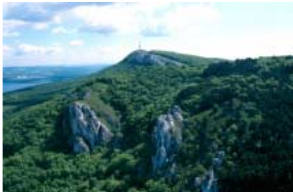
Pohled na vrch Děvín s televizním vysílačem