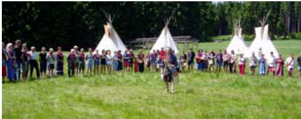
Zahájení ligového sněmu ve Skleném nad Oslavou