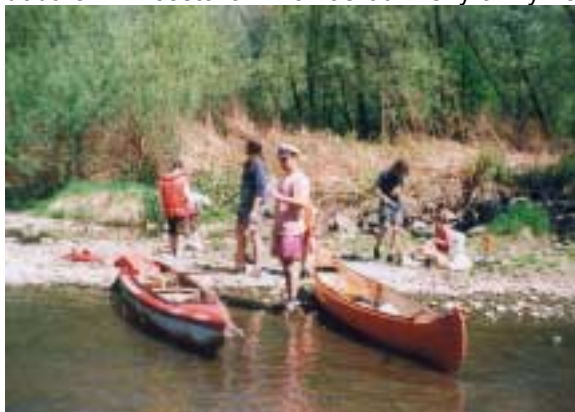
Malá pauza na svačinku