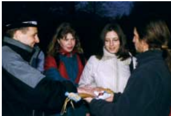
Nováčci skládají na kmenovou dýmku slib mlčenlivosti

Jako už posledních pár (nevím přesně kolik) let, jsme i letos přivítali první jarní východ slunce na ostravském Landeku. Nejdříve jsme se ale všichni, značně oteklí a rozespálí, sešli v 5 hodin u klubovny a pak odjeli hromadně trolejbusem pod Landek. (Kde jsou ty časy, kdy jsme mívali srazy cca o půl hodiny dříve a pak valili pěšky – zima – bezina, déšť – nedéšť ...)