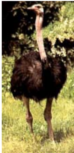
Pštros dvoupřstý Struthio camelus

chutnalo. Pak jsme ještě dělali druhou dávku – ze slepičích vajec – zmizela stejně rychle. Vlastně ani není mezi pštrosí a slepičí vaječinou žádný rozdíl v barvě ani v chuti, jenom když se pštrosí vejce vaří natvrdo, tak prý zmodrá (nebo zezelená) a vaří se podstatně déle, asi 30 minut. Druhý den tvrdili někteří slabší žaludkové, že jim bylo poněkud slabo, ale kdoví, co kde jedli (nebo pili), protože ostatním nic nebylo. Každopádně všichni přežili. Horší by to bylo, kdybychom museli pro vejce do pštrosího hnízda, protože takový pštrosí samec může měřit až 2,75 m (samice necelé 2 m) a běží rychlostí 70 km/h, takže by se před ním špatně utíkalo, navíc, když se naštvě, nebo je v ohrožení, brání se kopáním. Kopnutím své mohutné nohy dokáže prý zabít i lva, ale těžko říct, kam se musí trefit. Každopádně takový kopanec musí být pěkně bolestivý. Vyfouknuté vajíčko jsme prozatím uložili v klubovně, kde bude čekat nejmíň do příštích Velikonoc, až z něj někdo vyrobí maxikraslici. Arabské kultury připisují skořápce pštrosích vajec zvláštní moc, dávají je na střechy domů jako ochranu před bleskem.