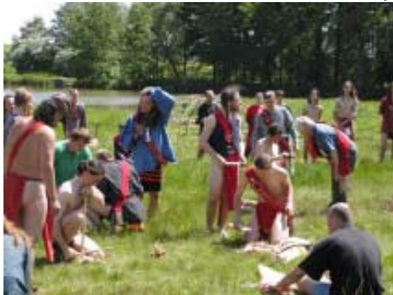
Soutěž v rozdělování ohně třením dřev