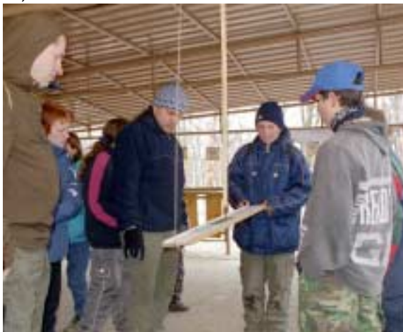
Dramatická jízda po prkně

Letošní kuličkiáda se nesla v duchu Velikonoc, které jsou tentokrát teprve přede dveřmi. Počasí bylo, řekla bych, tradiční ... Takže zima, vítr a občasné sněhové přeháňky. Sraz jsme měli o půl dvanácté u vrátnice a prošli jsme i letos na permanentku. A pak už se chystaly disciplíny – ty stejné, jako loni. No ve třičtvrtě na jednu už jsme se nemohli dočkat začátku, protože jsme byli pěkně omrzlí. Nakonec jsme se dočkali asi 90 účastníků, mohlo to být v tom