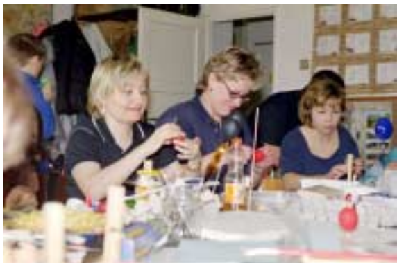
Mamky se „pokouší“ pod vedením náčelníka ozdobit kraslice

Tuto akci jsme letos pořádali poprvé. Přestože hned v pondělí měli všichni deváťáci (kromě Kvítka) přijímačky na střední školy, tak účast byla velká. Z kmene byli téměř všichni a pak spousta rodičů, hlavně mamky. Kluci s karabáčem se museli přesunout na chodbu, jelikož bychom se ani nevlezli ke stolu. Mamky donesly spousta buchet, takže jsme se i najedli, prostě pohoda. Kluci začali od jednoduchých tatarů (pod