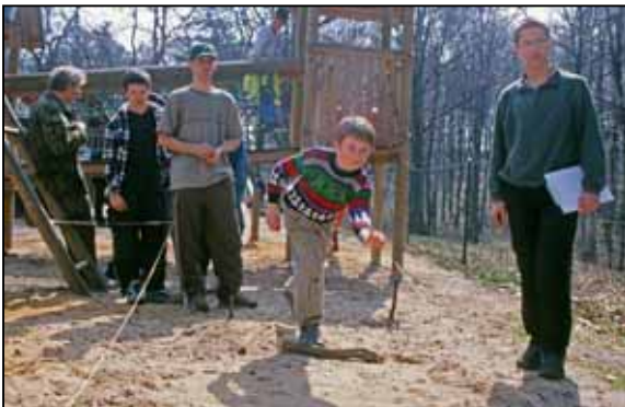
Hod na banku