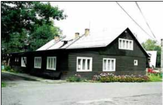
Budova finské sauny v Komorní Lhotce

asi polovina výpravy měla návleky – někteří i fungl nové, prostě návlekáři se u nás letos silně přemnožili.) I počasí nám docela přálo, cestou tam jen asi dvakrát začínalo lehounce sněžit a bylo i dost zataženo, ale na zpáteční cestě se nádherně vyjasnilo. Na Prašivé jsme samozřejmě hodili pauzu v chatě a dali si čaj atd. Zrovna jsme bohužel narazili na tlupu starých fotrů a fotřic, kteří tam na vrcholku stanovali (???) a hlavně se pak roztahovali v chatě (kde mimochodem byla teplota ne o moc vyšší než venku). Byli tam i „lyžníci“ – banda lidí v dobových oblecích a s těmi správnými lyžemi, a že prý bude nějaká přehlídka. Tak jsme nejdřív chtěli počkat, ale nakonec se ukázalo, že přehlídka bude dost statická – zato s fotkou typu: „Já a lyžník na Prašivé – zima 2004“ za 500,-- (možná i levněji). A tak