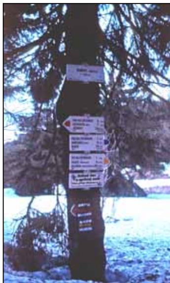
Rozcestník v sedle pod Smrkem

Asi v polovině cesty jsme už nasazovali návleky, protože sněhu už bylo asi po kolena. Nejhorší úsek nás čekal těsně před sedlem, asi tak 1 km, protože tam nebyla vůbec prošlapaná cesta. Sníh byl na povrchu celkem tvrdý, ale každou chvíli vám zajela noha dolů až po zadek, zvláště těžším osobám. Navíc nebylo vůbec poznat, kudy vede značka, ještě že Rotchild zná tuto trasu velmi dobře. Konečně jsme se vystrachali na sedlo. Červenou značku jsme měli v úrovni kolen a rozcestník v úrovni očí. Takže sněhu bylo určitě nejméně 1 metr. Cesta byla neprošlapaná i dále a navíc bylo už půl páté, a tak jsme se rozhodli, že oslavíme jaro v sedle. Takže obavy optimistů, že za dvě hodinky jsme nahoře, se nepotvrdily. Rozdělalí jsme oheň, opékali buřty a trochu sušili boty, i když to nemělo moc smysl. Boty měli promočené úplně všichni s výjimkou Blechy, jejíž gore-tex je ještě zánovní. V 6.02 vyšlo sluníčko. Zazpívali jsme společně ranní píseň, Gorbi