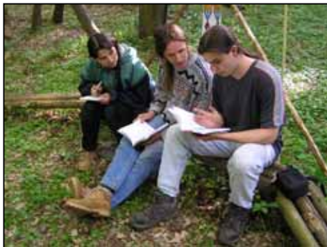
Bradek na Radě orlich per

No, to jsme se skutečně překonali, ani jsem nevěděla, že máme v kmeni tolik schopných sběračů smůly. Pak jsme zase jedli a potom šli na dřevo na večerní sněmovní oheň. Všechno probíhalo tradičně, chystal se oheň, někdo uklízel sněmovní kruh a někdo vše zpovzdálí kontroloval. Asi kolem 15 hodin zasedla Rada orlich per a proběhla velice rychle, takže pak bylo ještě spousta času na jiné aktivity – procházky po okolí, stavby přístřešků na noc, hry, průzkumné akce a podobně. Večer jsme se (nejdřív samozřejmě najedli) „hodili do gala“, tedy alespoň ti, kdo už byli dříve schopni si něco pro takové příležitosti obstarat, jiní jen odložili křiklavé barvy a zvolili decentnější tóny pro večerní toaletu. No a pak už byl slavnostně zahájen výroční sněm, program probíhal podle tradičního