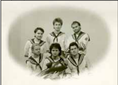
První sestava kapely

Zdravím všechny kmenové i nekmenové příznivce našeho časopisu. Máme tady novou rubriku „Hudební“, zde se budou objevovat články známějších i méně známějších skupin. Pro začátek jsem se rozhodl Vám představit některým dobře známou Valmezskou skupinu, která už na naše hudebním bitevním poli není zrovna krátkou dobu. Nebudu vás