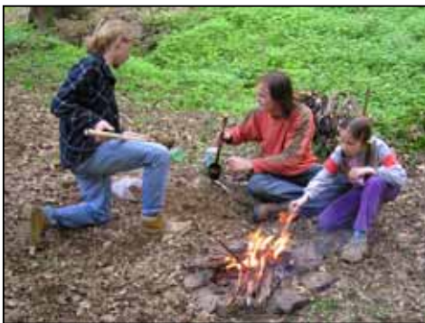
Výroba fakulí ke sněmu

vyjádřit údiv nad tím, jak některé soukmenovce nevyvede z „letargie“ nejen