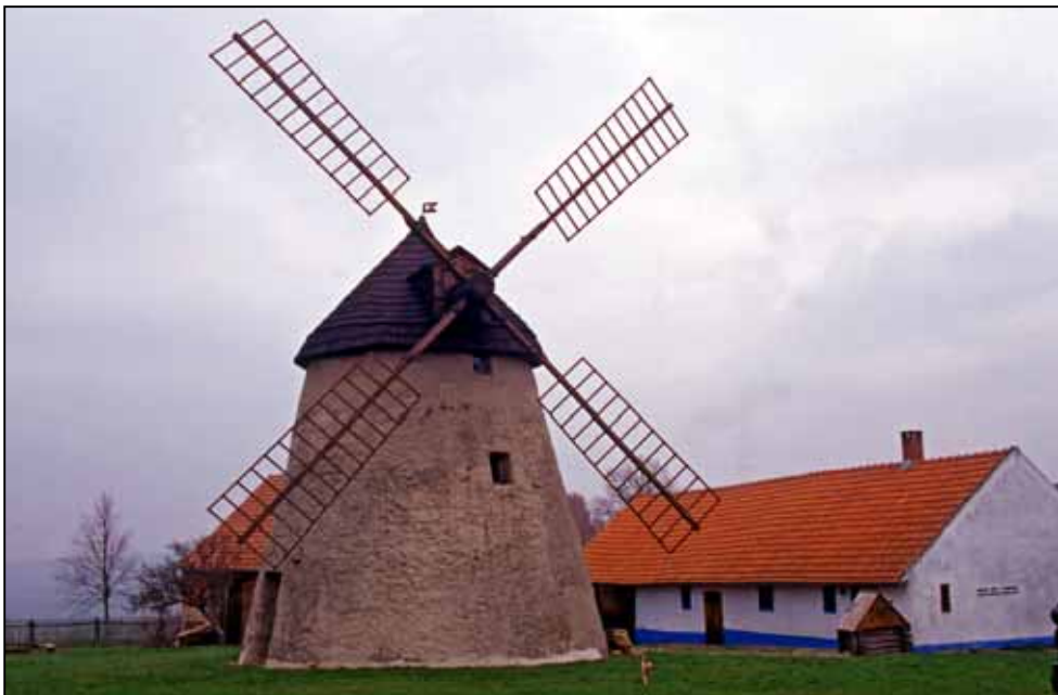
Větrný mlýn v Kuželově

nesmysly a smradlavé „voňavky“ za pět korun a uspokojovali svoje primitivní násilnické pudy na nic netušících, ubohých, spících, unavených, slabších, bezbranných a něžnějších protějšcích v domněni, že tím naplňují a završují význam Velikonoc. (Asi zapomněli, že Umučení bylo už v Pátek.) Poté se ještě dorazili čokoládovými vajíčky a dál už se nebudu raději vyjadřovat, protože Velikonoční pondělí a chlapy by od sebe měli oddělit, dohromady totiž tvoří neuvěřitelně protivnou a nesnesitelnou kombinaci.