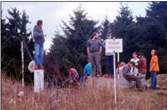
Na vrcholu Lopeník