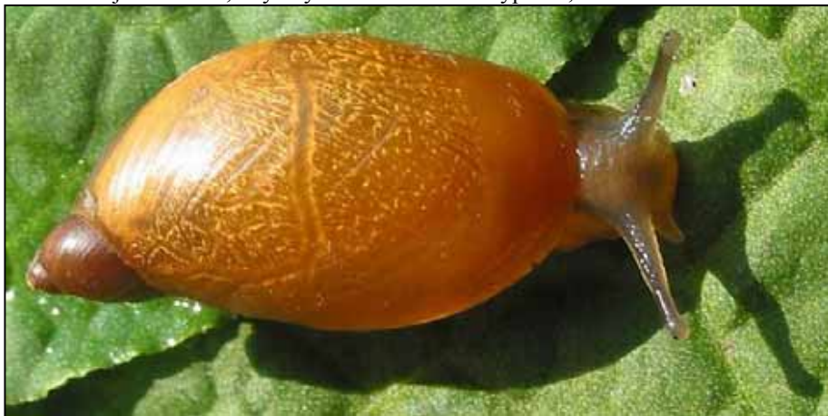
Jantarka obecná - Succinea putris

Je to jednoduché, když vyrazíme někam na výpravu, tak si s sebou většinou vezmu