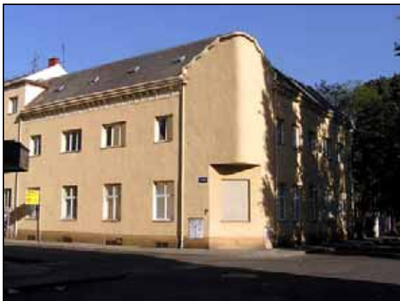
Budova organizace YMCA. V jejich prostorách jsme „prožili“ necelých 5 let činnosti.

Doufám, že si už všichni všimli, že náš kmen má novou klubovnu (a to dokonce na velice romantickém místě-u hřbitova.)