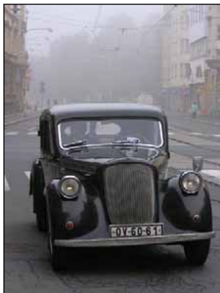
76 let starý rakouský Steyer 220