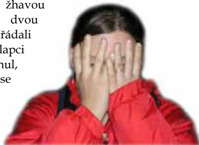
Druhá ze slečen - Kritrs

z kmene (abych napověděl, ale zase úplně neprásknul, tak jsou to bratři) začali „zajímavě“ rozumět se dvěma děvčaty z PS Sokol (viz fotky).