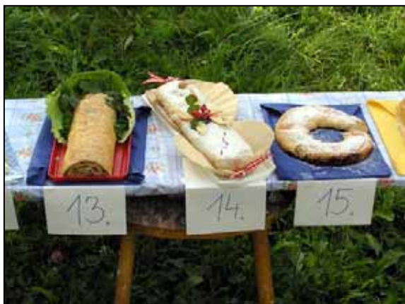
Štrúdl číslo 13 zvítězil.

Letošní štrúdlování proběhlo v sobotu 2. října a bylo trochu jiné oproti ostatním ročníkům, protože se konalo konečně v naší nové klubovně v Michálkovicích. Rodiče si mohli prohlédnout, na čem jsme tak dlouho pracovali, i jak to vypadalo na začátku,