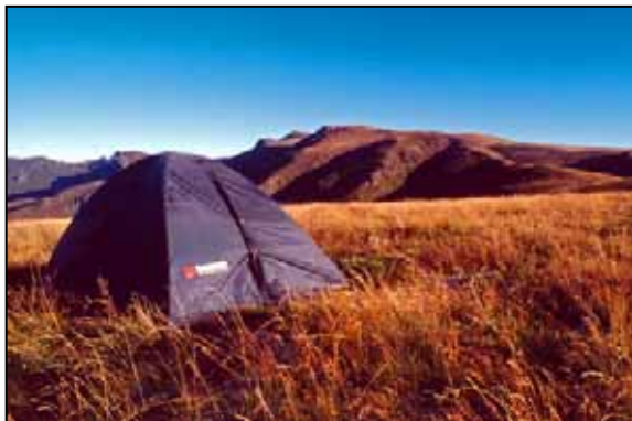
To není ukradeno z katalogu firmy Hannah, ale nekonečné pláně na Staré Planině

ukryli i před okolo všude přítomnými krávami. Kromě spousty osamocených jezer jsme z těch významnějších měli Rybni ezera, jejichž krásu kazily jenom turistické chatky, ale