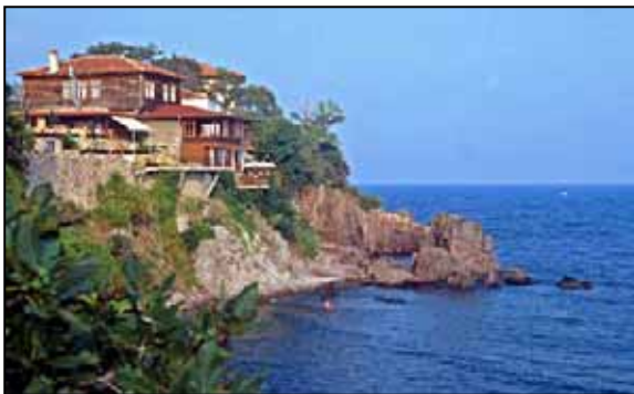
Pohoda v Sezopolu

zamávali moři a Bulharům a s pocitem skvěle strávených 3 týdnů jsme se už přece jen šíleně těšili domů, hlavně na Benjiho a na plnou vanu horké vody. Pokud máte pocit, že jsem popsala moc stránek a nic v podstatě neřekla, pak vám