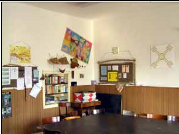
Stará klubovna - pohled od oken

Chvíli jsme je tak seděli, a povídali si, pak se slova ujal Tom a nastalo „loučení“.