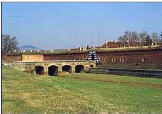
Vstup do Malé pevnosti Terezín

Bylo to "pěkně a zajímavě" strávené tři dny a určitě bych to doporučil navrhnout vašim učitelům. Ještě stojí za zmínku že dopravu platí terezínská iniciativa.