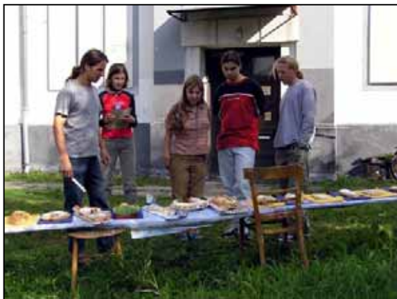
Porota s vytříbenou chutí a zapisovatelka Kečup

Pak následovala malá pauza a vyhodnocení hlavní soutěže. Na třetím místě se umístil