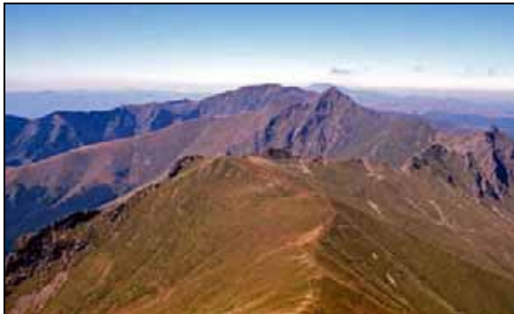
Hřebenovka na Staré Planině

byl hlavně BF nadšen. Následující asi tři dny jsme si užívali tradiční dovolenou u moře s koupáním, procházkami po městě a večerním vyseďáváním po kavárnách s živou hudbou a ranními čerstvými ještě teplými bánicemi s pravým balkánským sýrem. Taky jsme si udělali výlet do přírodní rezervace Ropotamo, s vyjížděnou lodí po řece a pak individuální obhlídkou turisticky méně atraktivních částí. No ale pak už se začalo kazit počasí, tak jsme si řekli, že je čas vyrazit na hory. Předtím ovšem bylo třeba zbavit se