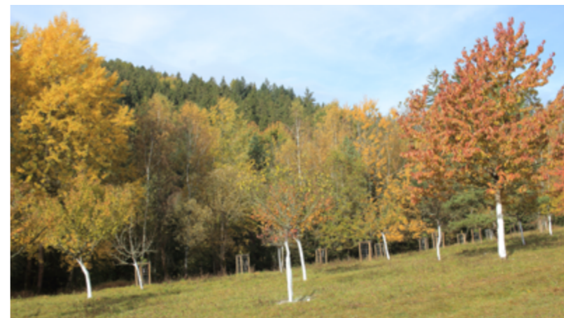
ošetřený sad na horní louce

Stav vodovodů a topení byl chvílemi havarijní. I tak jsme si prázdniny krásně užili.