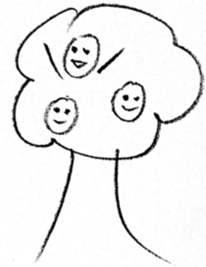
skica: Honza Sláma